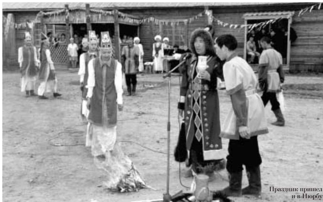
Праздник пришел и в Нюрбу

Появление ОАО "АЛРОСА-Нюрба" напрямую связано с открытием на нюрбинской земле месторождения алмазов. В 1997 году было принято решение о создании дочернего предприятия АК "АЛРОСА", которое бы явилось мощнейшим экономическим рычагом для привлечения инвестиций.