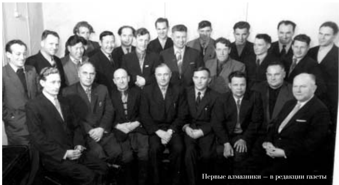
Первые алмазники – в редакции газеты