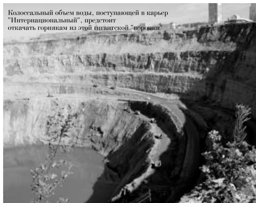
Колоссальный объем воды, поступающей в карьер "Интернациональный", предстоит откачать горнякам из этой гигантской "воронки"

По серпантинам деловито снуют большегрузные самосвалы, роко-чут дизели бульдозеров, а мощные экскаваторы черпают из открытых забоев породу и алмазосодержащую руду.