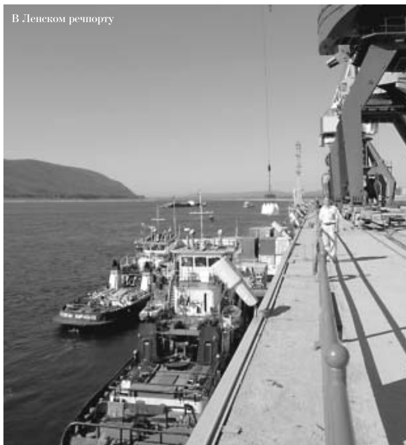
В Ленском речпорту