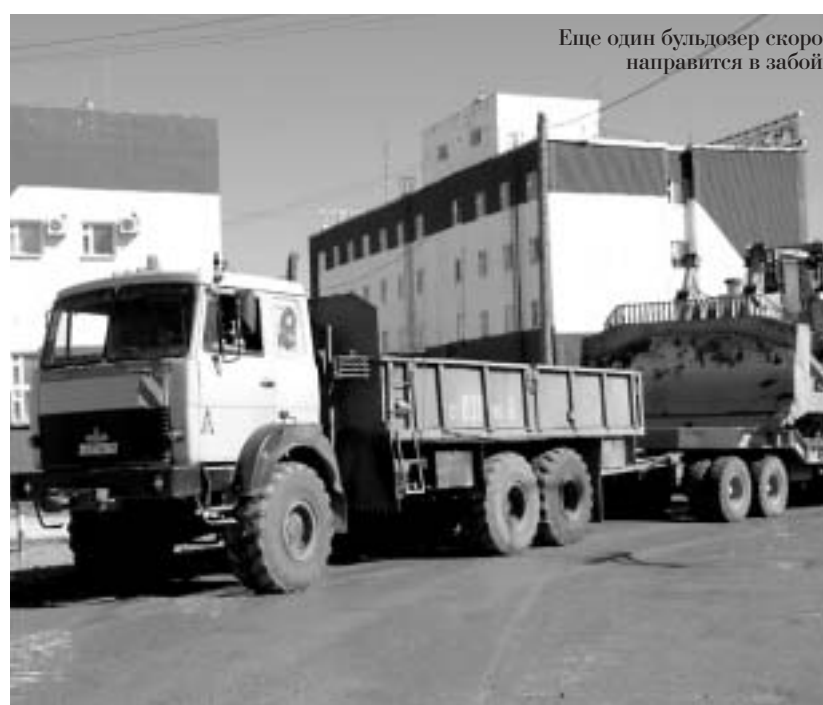
Еще один бульдозер скоро направится в забой

Вновь, как много лет назад, оживленно в карьере трубки "Интернациональная" – продолжается отработка подкарьерных запасов месторождения.