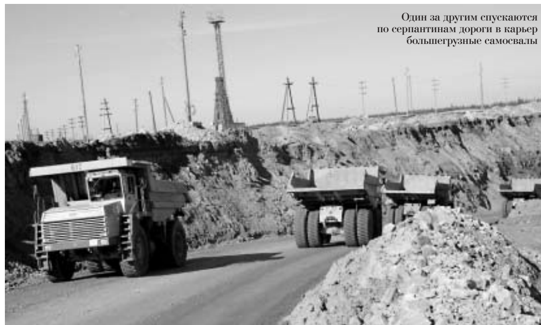
Один за другим спускаются по серпантинам дороги в карьер большегрузные самосвалы