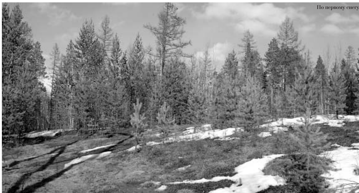
По первому снегу