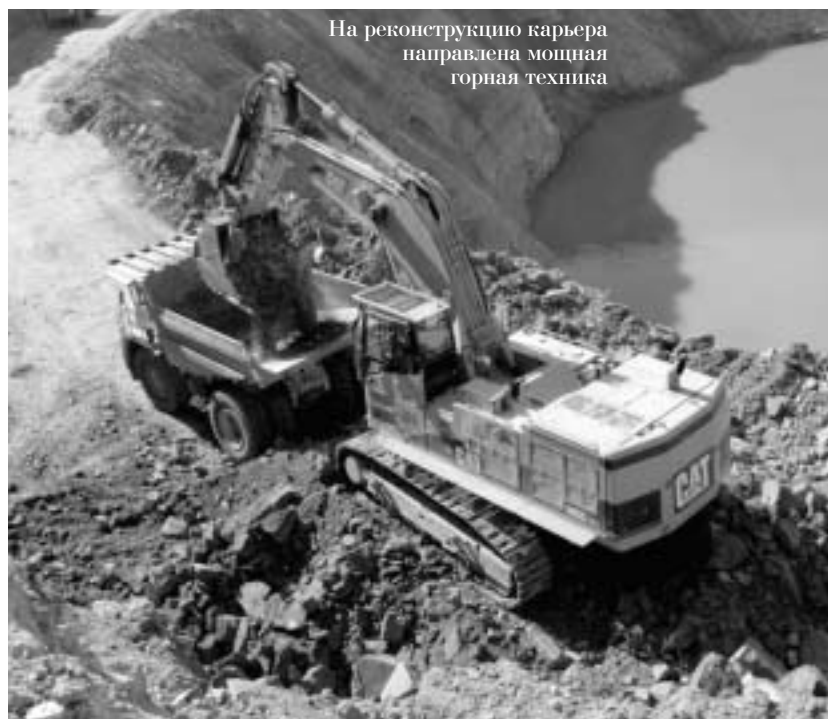
На реконструкцию карьера направлена мощная горная техника