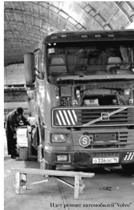
Идет ремонт автомобилей "Volvo"