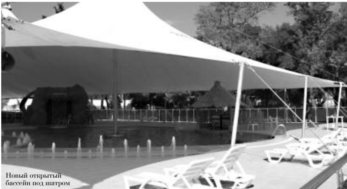
Новый открытый бассейн под шатром

Конечно, сегодня "Голубая волна" является лидером корпоративных оздоровительных курортов. Это единственная здравница, гордо несущая титул "многопрофильный круглогодич-