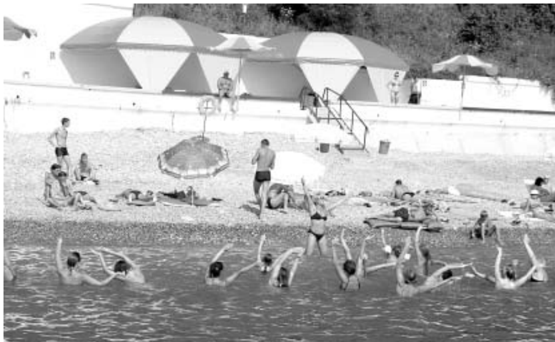
Аквааэробика на пляже

Еще месяц назад многие работники "АЛРОСА" отдыхали в здравницах компании. Каким было прошедшее курортное лето?