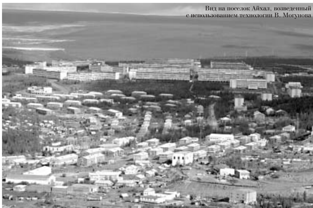
Вид на поселок Айхал, возведенный с использованием технологии В. Могунова

– Нисколько. В итоге мы – коллективы института "Якутнiproалмаз", строителей компании и эксплуатационников – начали выпускать высококачественную продукцию. И Айхал, и Удачный "стоят" на бесце-