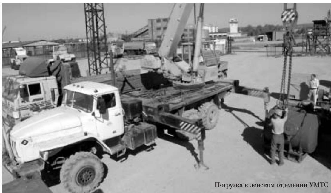
Погрузка в ленском отделении УМТС