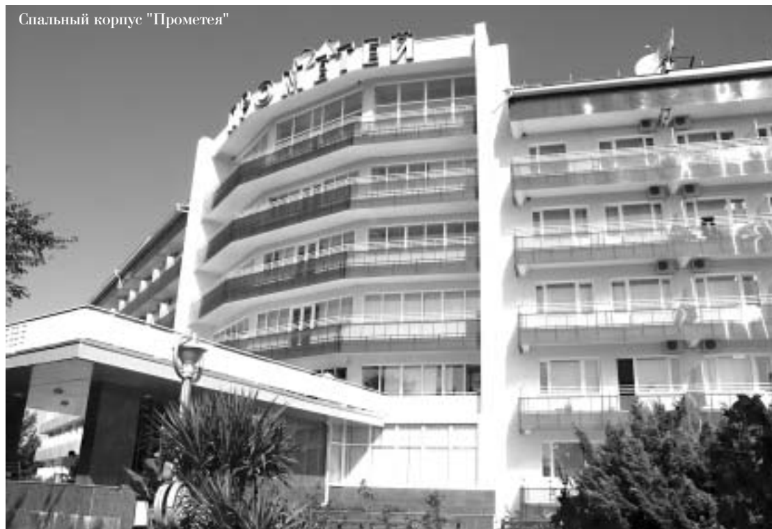
Спальный корпус "Прометей"

В последний раз здравницы "АЛРОСА" на Юге России попадали в поле зрения нашей редакции в 2005 году. Результаты наблюдений можно прочитать в материале "Я люблю тебя, море!", опубликованном в 9-м номере "Вестника АЛРОСА" за упомянутый год. К сожалению, тогда без внимания остался оздоровительный комплекс "Прометей", расположенный в поселке Небуг под Туапсе. Дабы восполнить данный пробел первым пунктом моей командировки я выбрал именно его.