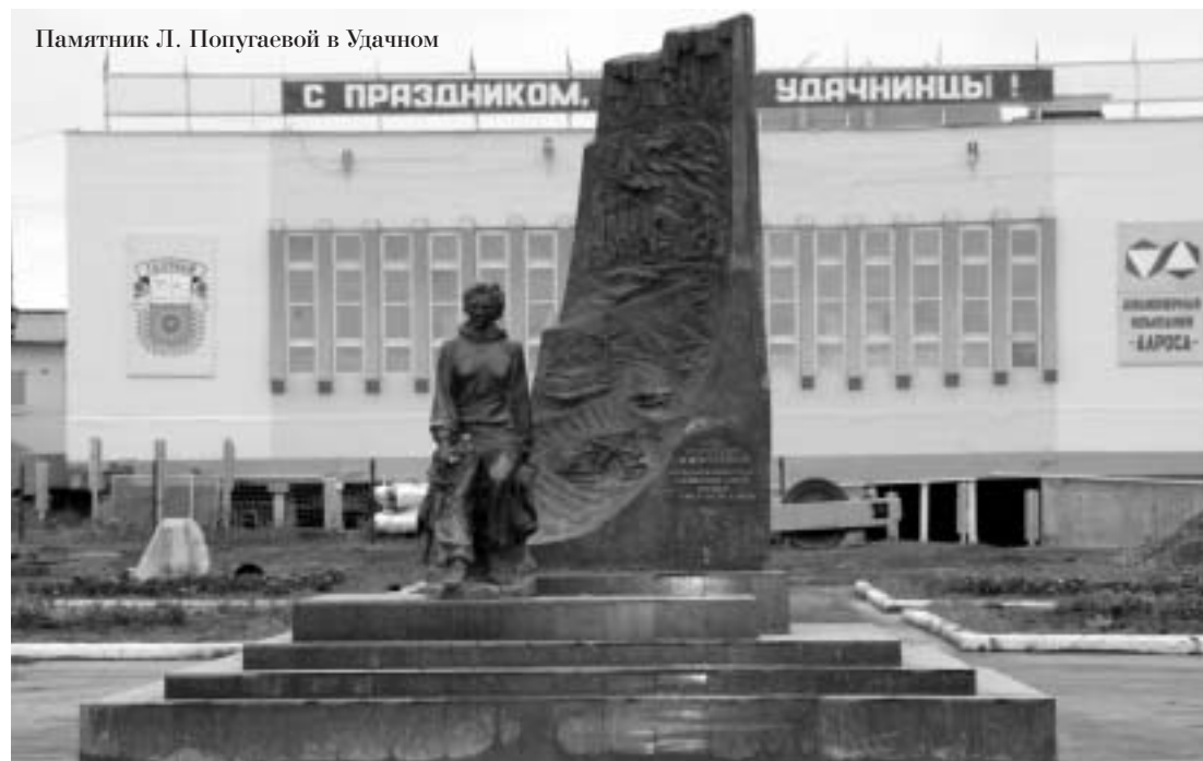
Памятник Л. Попугаевой в Удачном