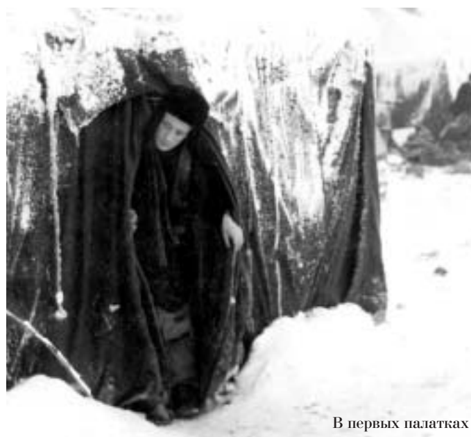
В первых палатках

Исполнилось 80 лет известному журналисту Якутии Эдуарду Рыбаковскому. За большой вклад в развитие российской журналистики и в ознаменование юбилея его именем назван ювелирный алмаз весом 74,11 карата, добытый на фабрике №14 из руды трубки "Юбилейная".