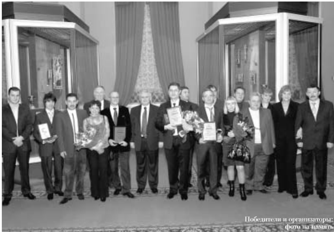
Победители и организаторы: фото на память

— Конкурс стал для нас хорошей традицией. Он позволяет нам увидеть воочию те шаги, которые ведут к прогрессу в ювелирном искусстве. Мы искренне