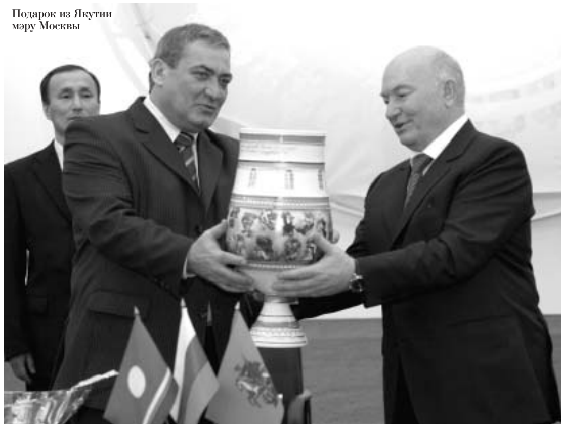
Подарок из Якутии мэру Москвы