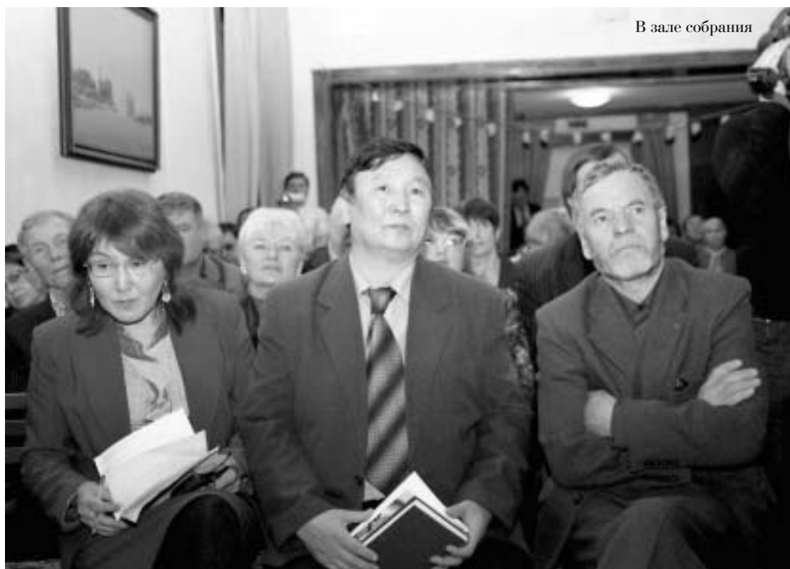
В зале собрания