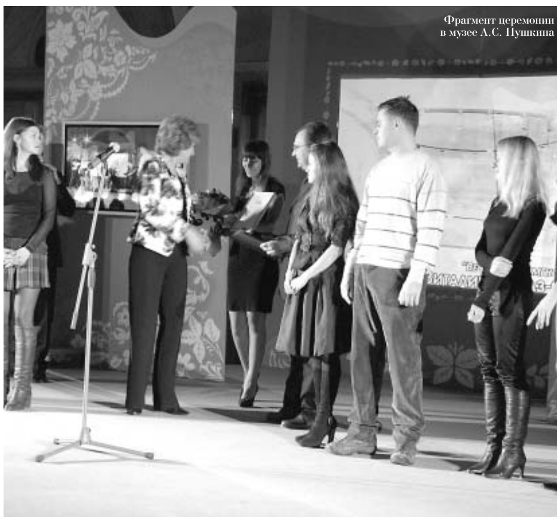
Фрагмент церемонии в музее А.С. Пушкина

Таковые в конкурсе могут представлять как ювелирные предприятия, творческие коллективы, художественные учебные заведения, так и самостоятельно работающие художники и ювелиры. За минувшие годы