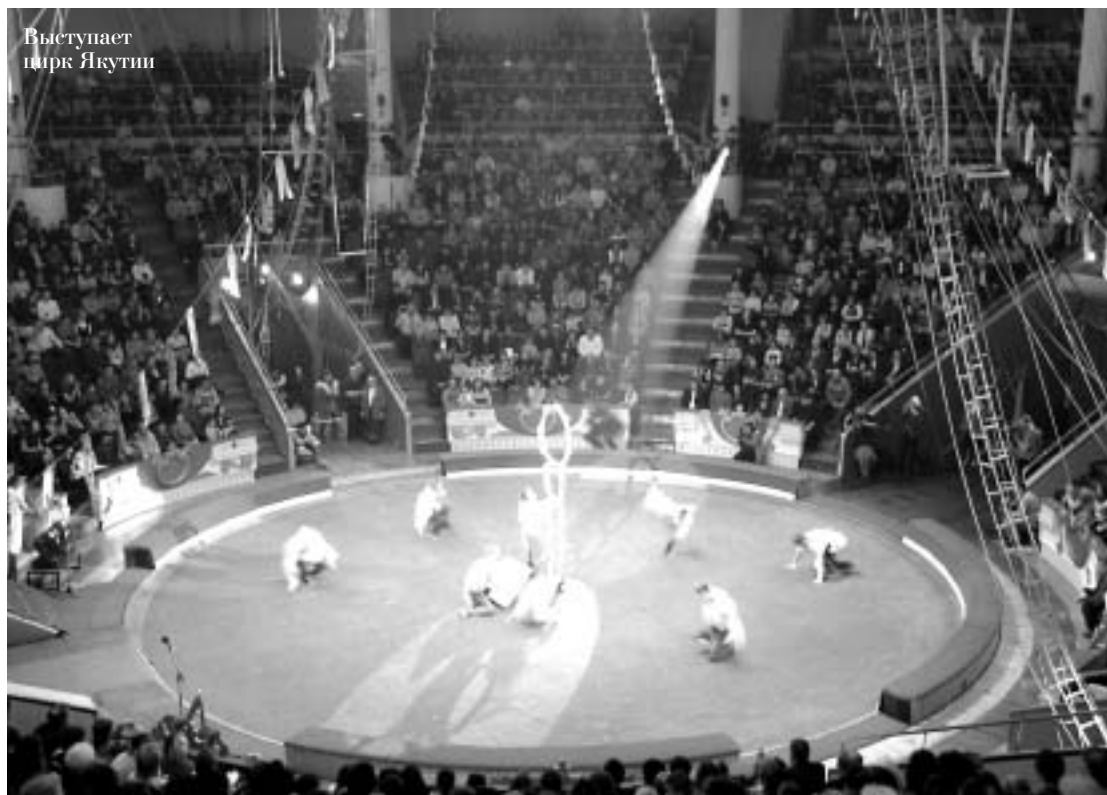
Выступает цирк Якутии