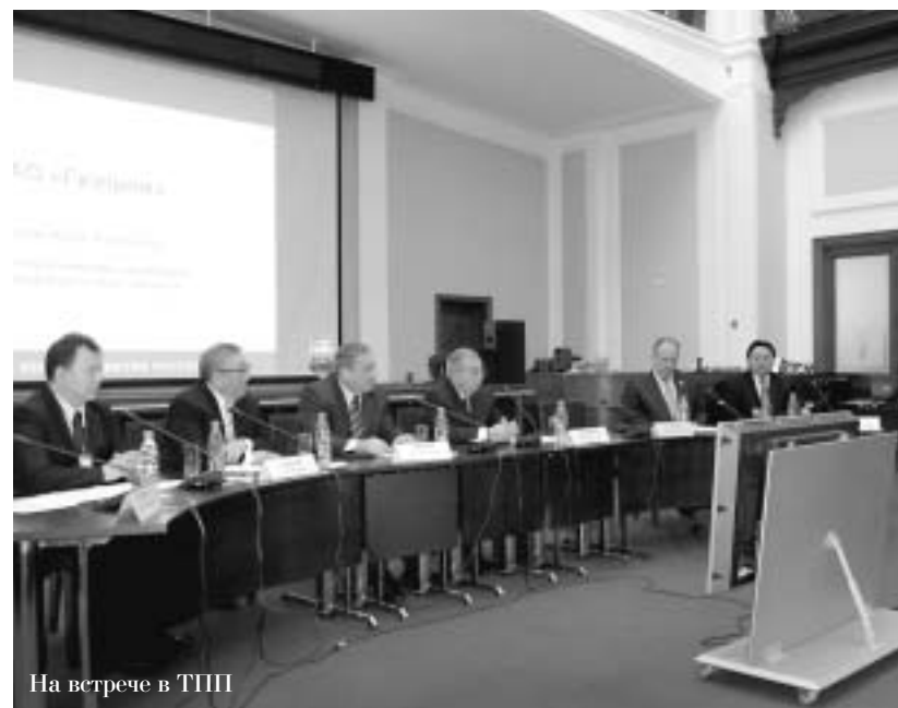
На встрече в ТПП

В Москве 3-9 декабря минувшего года прошли Дни Якутии в честь 375-летия добровольного вхождения республики в состав Российского государства. Столица России отметила экономический и культурный потенциал Якутии. Генеральным спонсором праздника выступила компания "АЛРОСА".