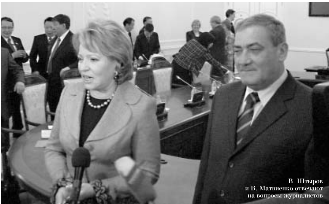
В. Штыров и В. Матвиенко отвечают на вопросы журналистов

На другой день во Всероссийском научно-исследовательском геологическом институте им. А.П. Карпинского (ВСЕГЕИ) состоялась встреча с ветеранами алмазодобывающей промышленности и ветеранами-геологами, много лет отдавшими освоению Крайнего Се-