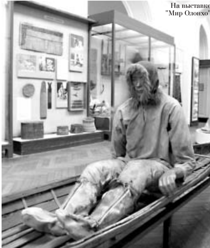
На выставке "Мир Олонхо"