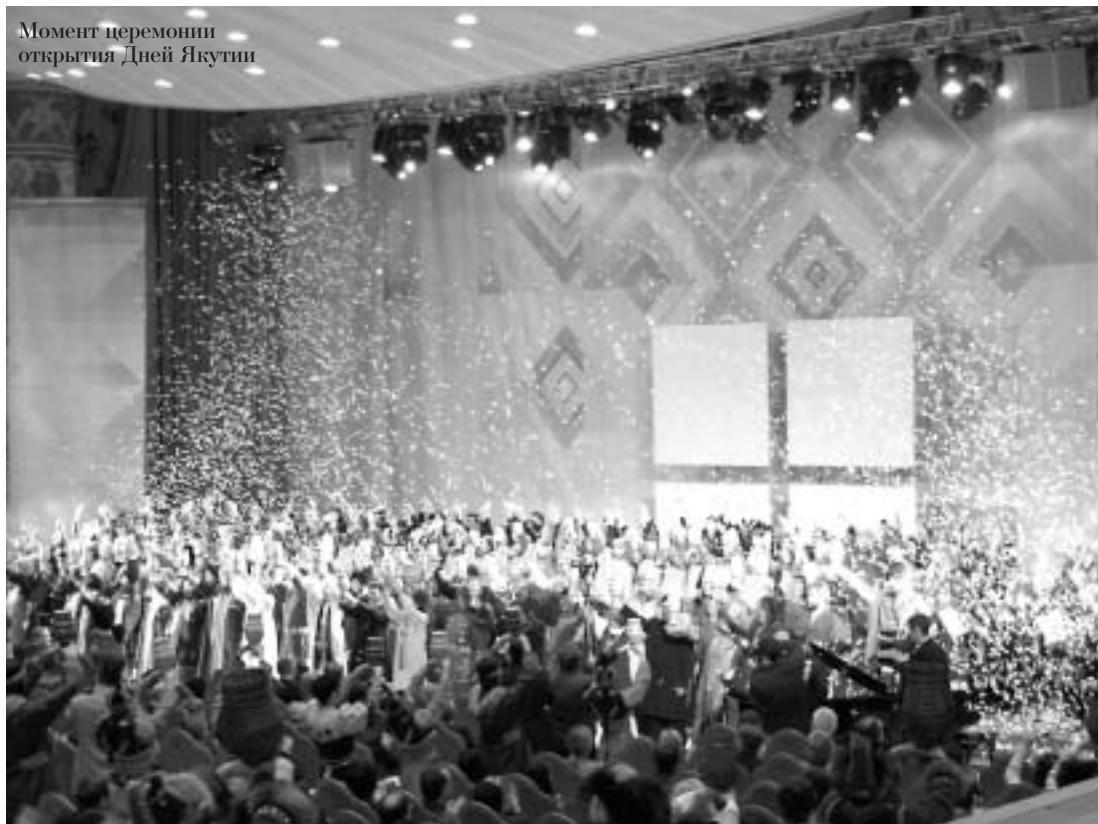
Момент церемонии открытия Дней Якутии