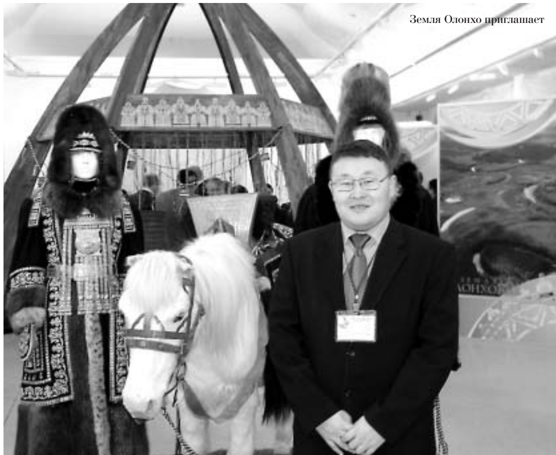
Земля Олонхо приглашает

8 декабря ознаменовалось всероссийским турниром по мас-рестлингу на призы президента Якутии и вечерним спектаклем в театре "Et Cetera" – премьерой чеховских "Трех сестер" в постановке молодого режиссера Саха-театра, облада-