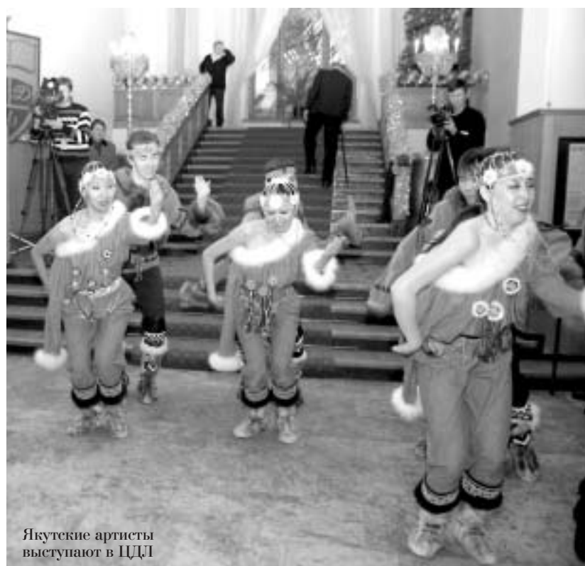
Якутские артисты выступают в ЦДЛ