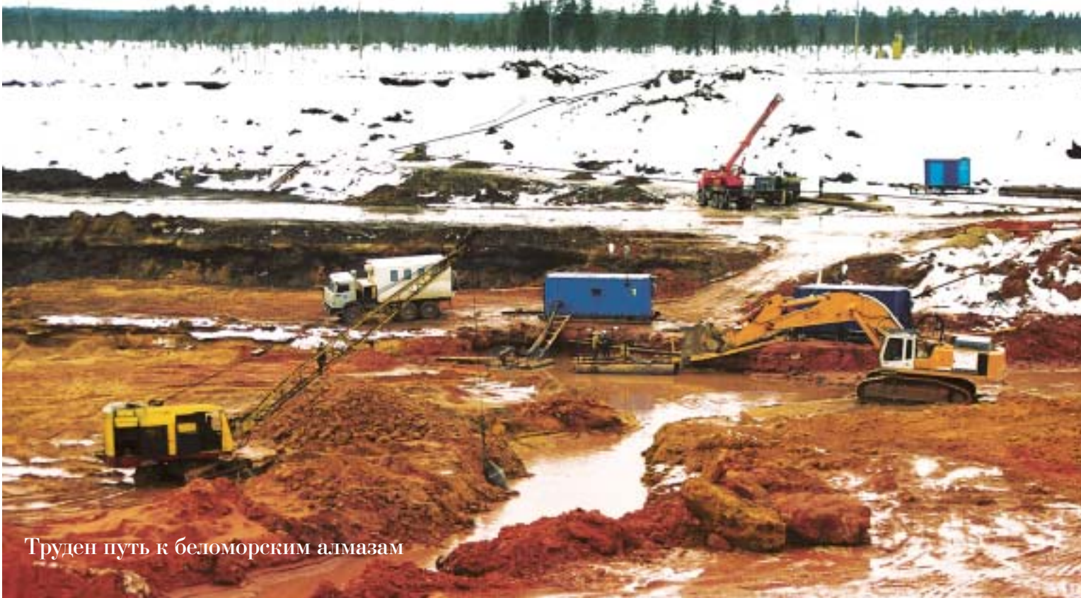
Труден путь к беломорским алмазам

Ежегодно компания "АЛРОСА" направляет на реализацию программы "Здоровье" 300 миллионов рублей