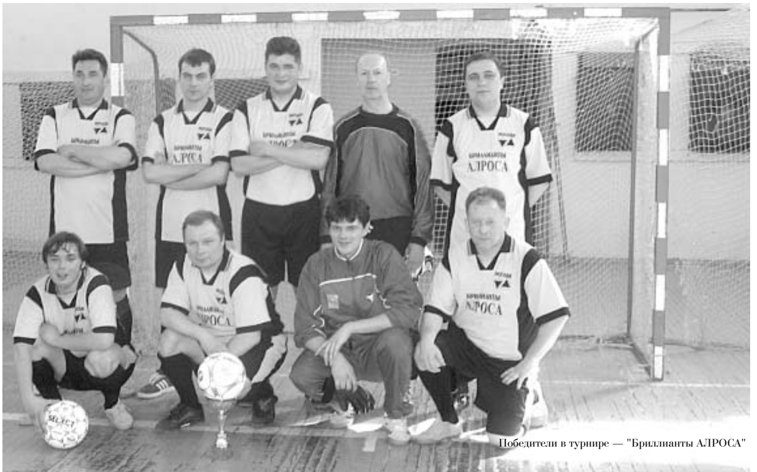
Победители в турнире — "Бриллианты АЛРОСА"

Не меньше споров вызвало и неудачное выступление "Представительства Управления Делами", считавшееся фаворитом турнира. Предполагалось, что основная борьба за первое место развернется между этой командой и нынешним лидером — "Бриллиантами АЛРОСА". Однако, коллектив подошел к соревнованиям в ослабленном составе — некоторые игроки не могли принять участие из-за болезни. Потому, не-