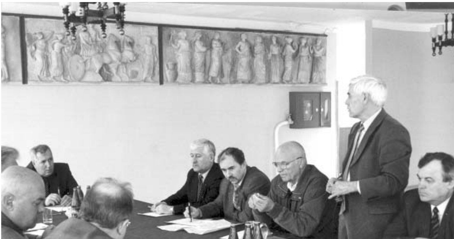
Совещание ведет президент "АЛРОСА"

Первым пунктом остановки и работы стала база отдыха АК "АЛРОСА" в г. Анапа. Возможности этой здравницы в масштабах компании невелики, но надо учесть, что она расположена в пос. Витязеве, в нескольких километрах от прекрасного города-курорта Анапа, славящегося своим мягким, солнечным климатом и удивительными песчаными пляжами. Здесь уже сегодня практически все готово