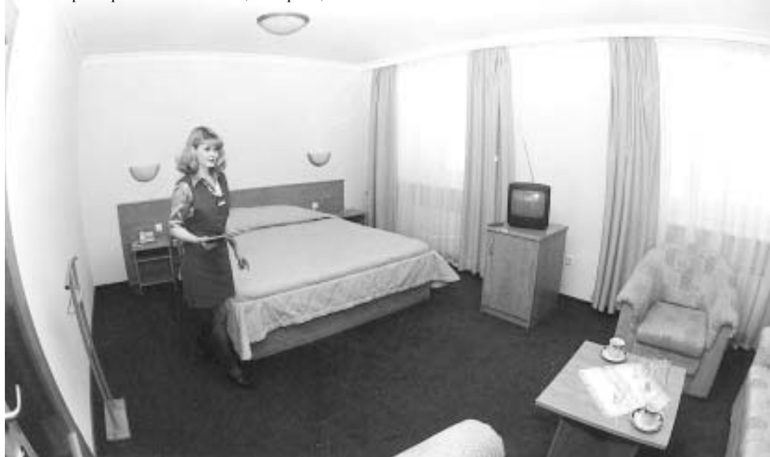
В номере мирнинской гостиницы "Зарница"