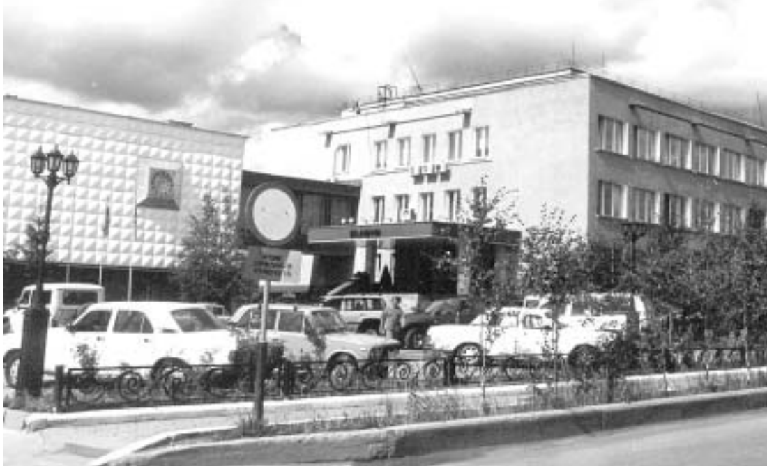
Офис АК "АЛРОСА" в Мирном

11) усилить контроль за реализацией плана мероприятий по за-