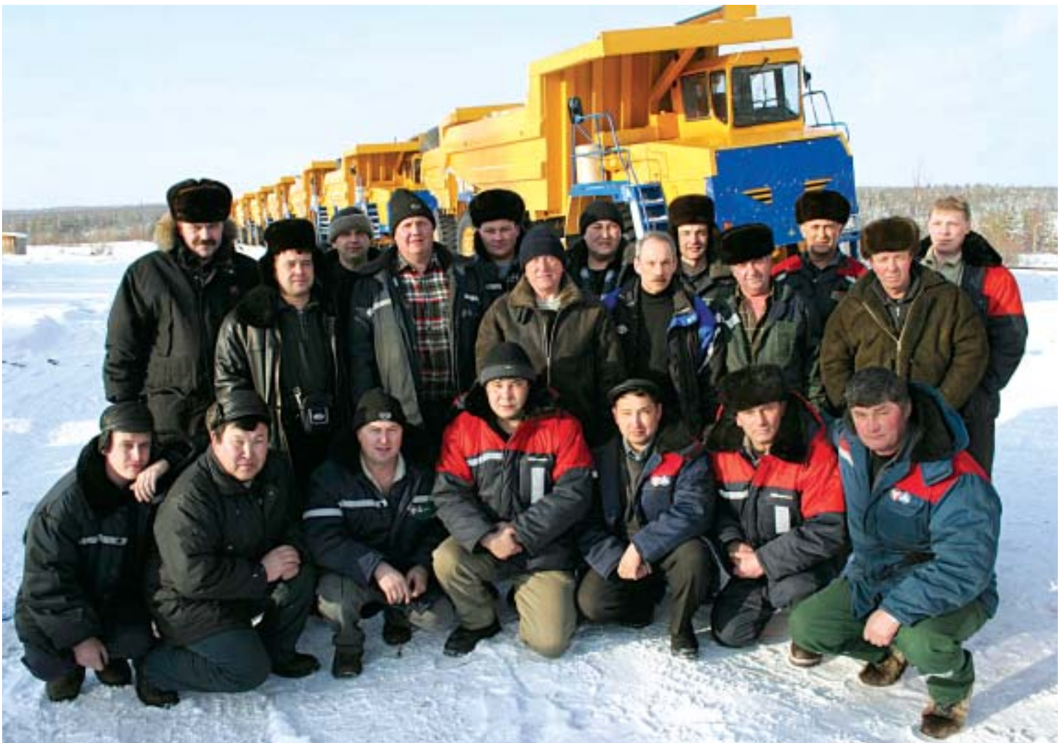
Группа участников переезда

расширяет поиски алмазов на севере Якутии, готовит концепцию развития до 2015 года