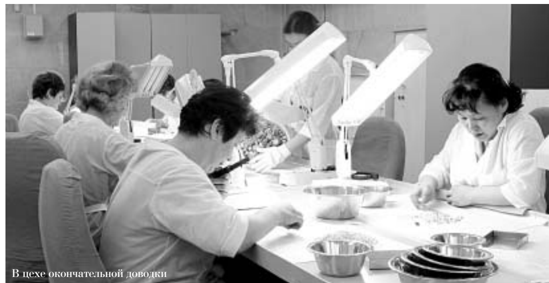
В цехе окончательной доводки