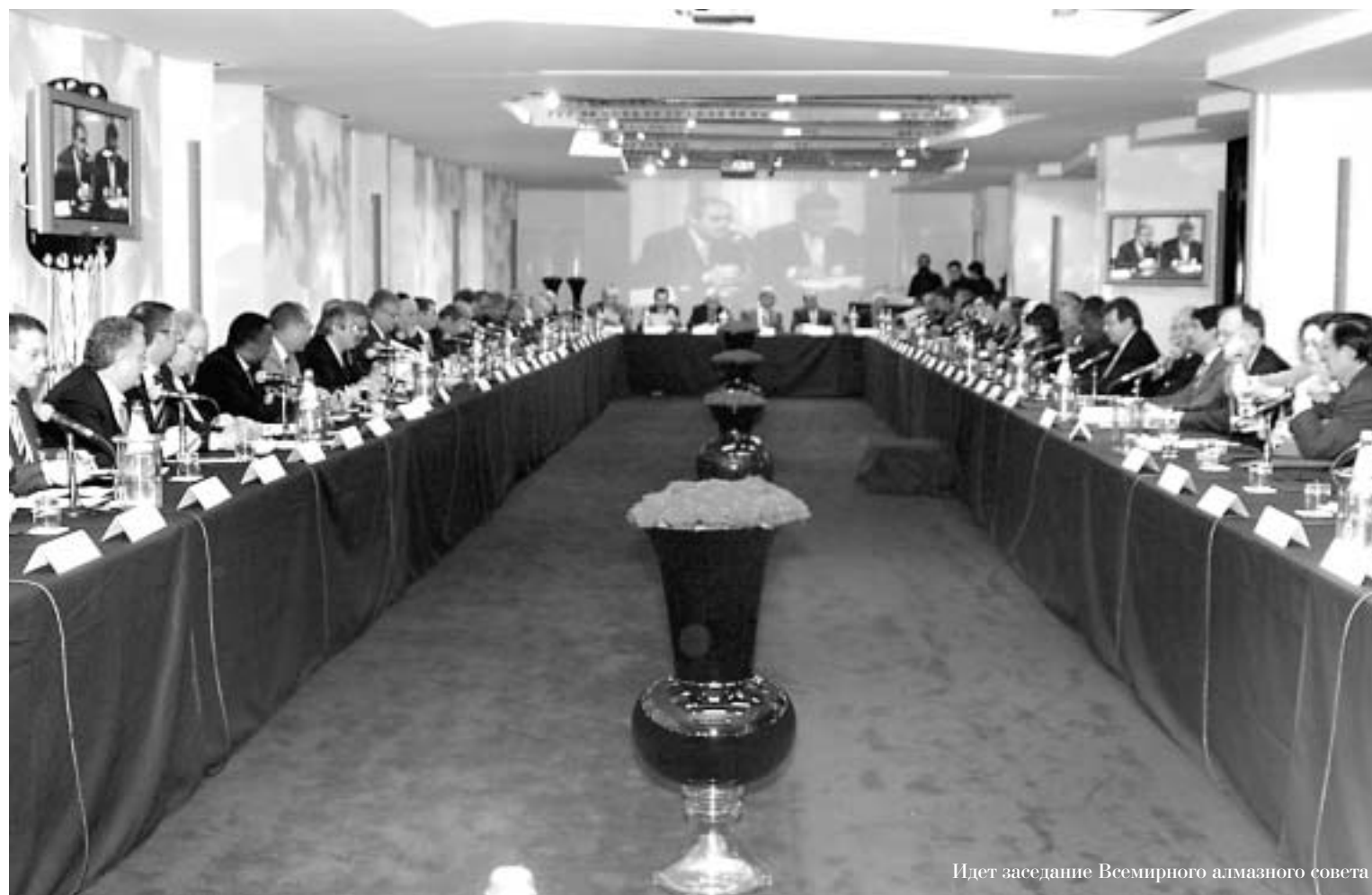
Идет заседание Всемирного алмазного совета