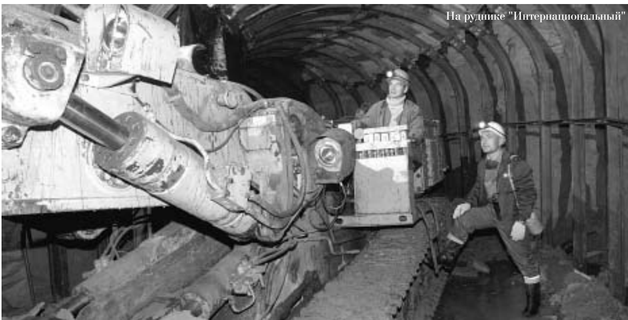
На руднике "Интернациональный"

– Скорее всего, на трубке "Айхал", отличающейся высоким каче-