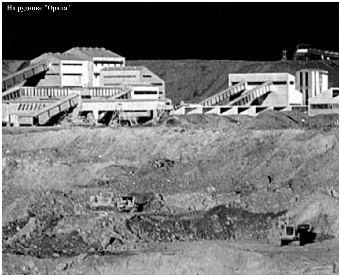
На руднике "Орапа"

Это место в пустыне Калахари зовется Джваненг, что в переводе с языка сетсвана означает "Там, где камешки", то есть алмазы. И не прилип ли случайно какой "камушек" к подошве? Но вот жена отряхивает обувь, демонстрирует ладони — и сопровождающий наконец расслабленно улыбается. Все в порядке, экскурсия продолжается. Разрез принадлежит "Дебсване" — совместному предприятию "Де Бирс" и правительства Ботсваны.