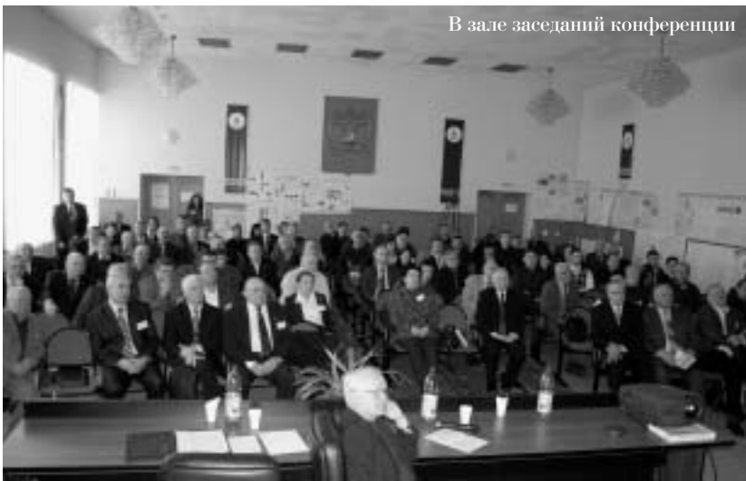
В зале заседаний конференции