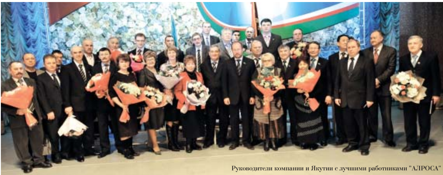
Руководители компании и Якутии с лучшими работниками "АЛРОСА"

Месторождения Накына будут отрабатываться открытым способом