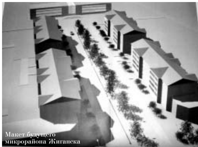
Макет будущего микрорайона Жиганска

Новая геологоразведочная экспедиция, созданная для поиска месторождений в северных районах Якутии, готовится к масштабным поискам.