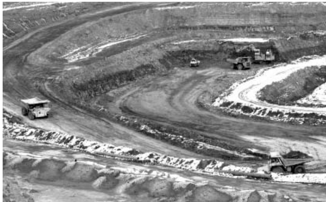
Горная техника в карьере месторождения им. М.В. Ломоносова.

Работает на фабрике 124 человека, в смене 46 человек технологичес-