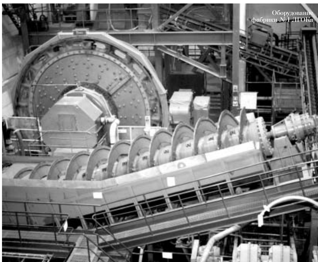
Оборудование фабрики №1 ЛГОКа

Само предприятие по численности персонала небольшое – 861 человек. Средний возраст людей – 39 лет. Женщин у нас работает немного – всего 20 процентов, в основном на фабрике и в управлении. Есть некоторые трудности с подбором машинистов экскаваторов, бульдозеров и водителей большегрузного транспорта.