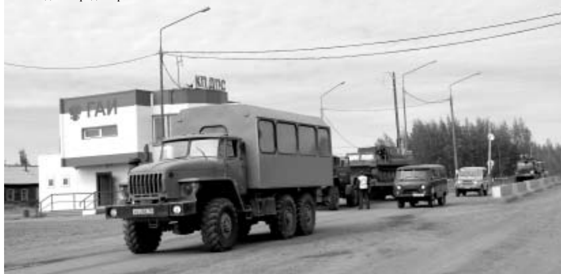
У въезда в город Мирный

вать в нашей деятельности финансовые ориентиры, распределять материальные, технические, трудовые ресурсы. Отпала необходимость ездить каждый раз в Ленск по поводу различных согласований, связанных с тем или иным объемом намечаемых работ, с передислокацией техники на какие-то объекты. Словом, сократилась часть служебных командировок и многие излишние километры пути. Хотя объективности ради надо признать, что особого административно-