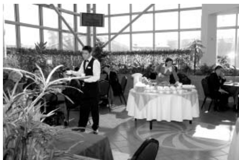
Теплоход "Михаил Светлов"