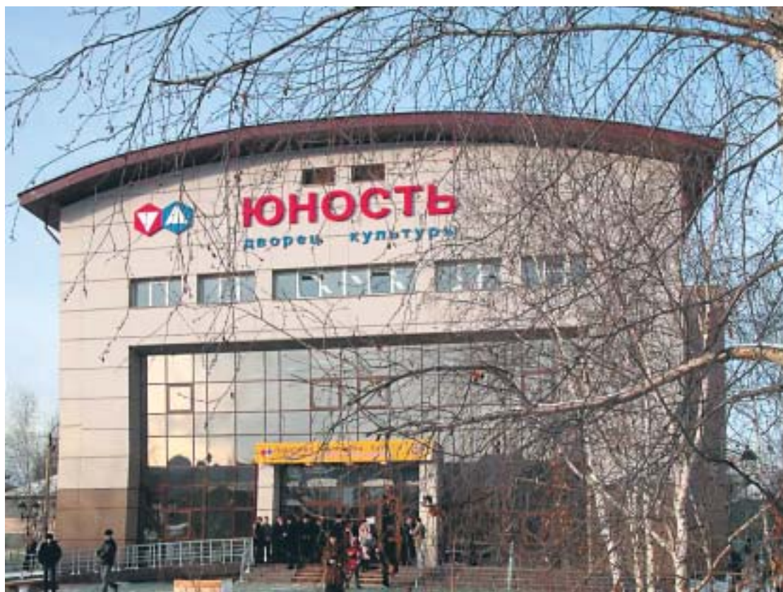
"Юность" – не только Дворец культуры, но и архитектурное украшение города

В Ленске состоялось открытие обновленного Дворца культуры "Юность". Вернее даже будет сказать нового, так как во время строительства была использована лишь незначительная часть бывшего кинотеатра, которая, преобразившись, даже частично не напоминает очертания старого здания, прослужившего ленчанам почти четыре десятка лет.