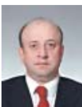
Председатель Комитета Госдумы по конституционному законодательству и государственному строительству Владимир Плигин: ...Безусловно, компания "АЛРОСА" – достояние всей

Северные территории очень сильно зависят от крупных компаний, я это знаю не понаслышке. И назовите мне хоть один регион, где из-за действий федерального правительства ухудшилась социально-экономическая ситуация. Да, порой здесь, даже среди коллег в Госдуме, мы не находим понимания по северной проблематике. Но если мы говорим о развитии регионов, в том числе северных, в контексте общероссийского развития, то узкоместные интересы должны уйти на второй план.