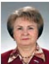
Председатель Комитета Госдумы по проблемам Севера и Дальнего Востока Валентина Пивненко: ...В российской экономике есть стратегические отрасли и стратегические предприятия, к

Главный и основной принцип государственного подхода в отношении крупных недропользователей заключается в принципе – не навреди. Например, "АЛРОСА" вкладывает свои собственные средства в геологоразведку, тем самым ведет работу по расширению минерально-сырьевой базы России, в новые технологии добычи алмазов. То есть ей не нужна государственная помощь ни со стороны федерального центра, ни со стороны субъекта Федерации. Этой компании просто не надо мешать вести свой прибыльный бизнес.