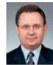
Председатель Комитета Госдумы по местному самоуправлению Владимир Мокрый: ...Ресурсное, а значит и валютное обеспечение интересов госу-

Якутия или какой-либо другой субъект Федерации не заинтересованы в каком-то конкретном предприятии, они должны быть заинтересованы в бизнесе на его территории. Какие интересы местного бюджета могут быть нарушены, если компания будет открытой – не знаю. Если акции купят москвичи или иностранцы – в чем здесь проблема? Они что, унесут это предприятие с собой? Унесут земли, на которых расположено это предприятие? Унесут производственные объекты, являющиеся объектом налогообложения? Нет! Задача региона – поддерживать занятость населения, поддерживать посылно экономическую эффективность субъектов.