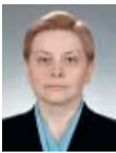
Председатель Комитета Госдумы по природным ресурсам и природопользованию Наталья Комарова: ...Такие стратегические и крупные в своих

отраслях компании, как "Газпром", "АЛРОСА", "Роснефть", должны управляться исключительно государством. Федеральное правительство работает в интересах всего российского общества, а это значит, что именно в его руках должны быть сосредоточены все управленческие вопросы. Возможно, через какое-то время, когда ситуация изменится, государство может и уменьшить свое влияние в данных компаниях. Но сегодня, когда сложилась благоприятная ситуация на рынках нефти, газа, алмазов, и государство имеет максимальный доход, мы все заинтересованы в сохранении госконтроля.