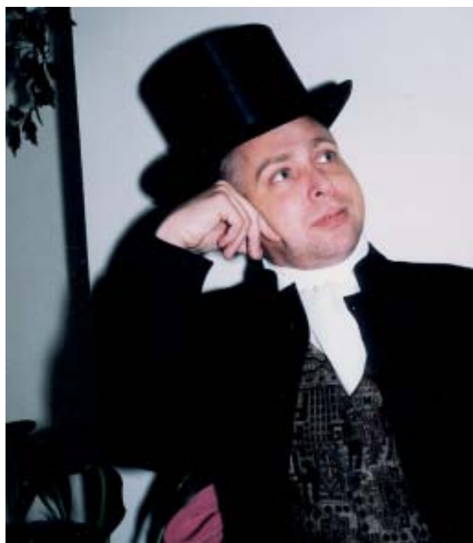
Актер В. Зайцев