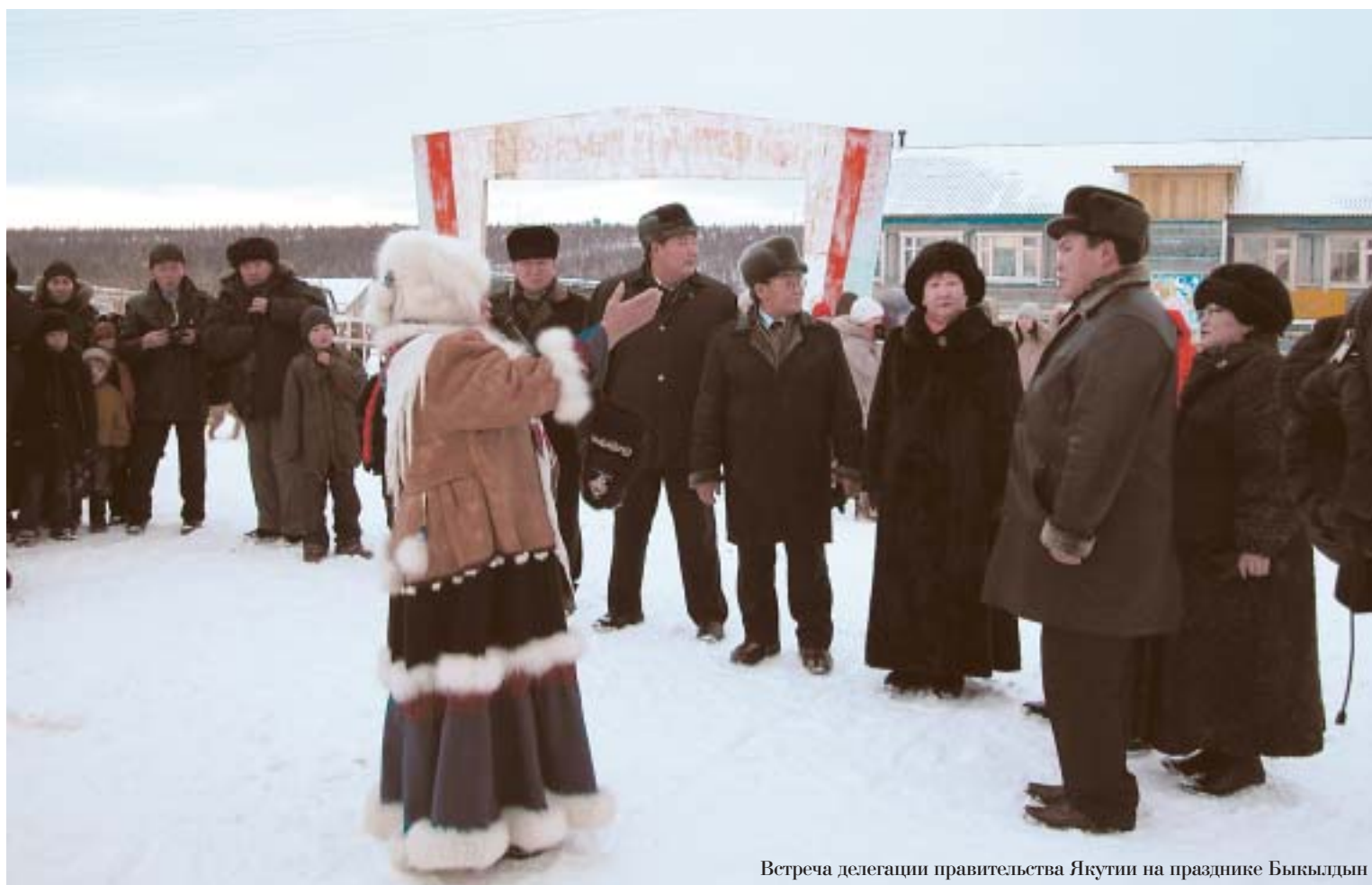
Встреча делегации правительства Якутии на празднике Быкылдын

нинский комбинат, как шеф Оленекского улуса, с начала 2005 года из своей учетной прибыли оказал материальную помощь району в размере 9 миллионов рублей. На эти деньги построен дом для ветеранов, спортивный зал в селе Харьялах, для села Эйик приобретена котельная стоимостью 5 миллионов рублей.