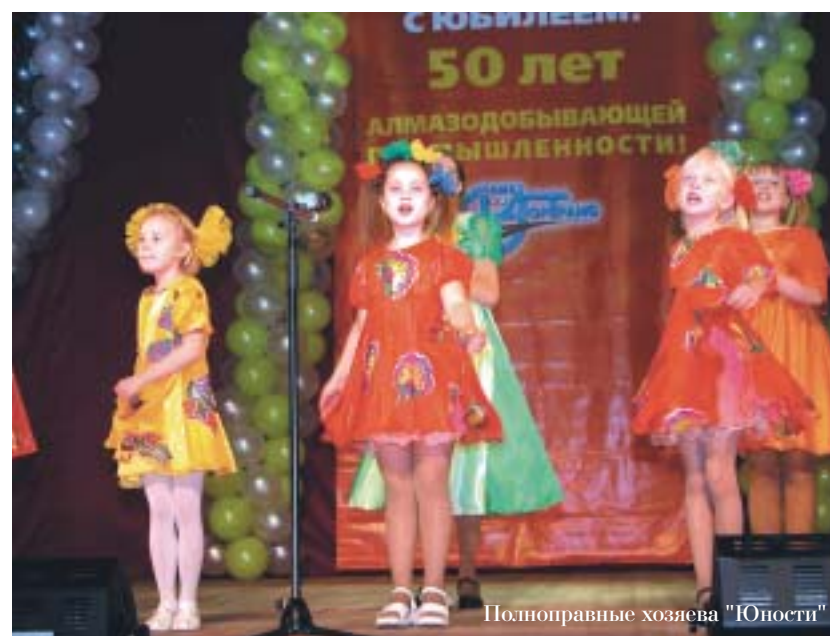
Полноправные хозяйки "Юности"

Хозяева нового Дворца культуры – исполнители и танцевальные коллективы ЦСО "Алмаздортранс" – вложили в подготовку презентации максимум усилий и поэтому блистали на сцене во всей красе. Безусловно, приятным и волнительным моментом вечера стало награждение главных героев дня – строителей. Благодарственные письма от "Алмаздортранса" были вручены представителям строительной компании "Ситех" (г. Новосибирск), Ленского отделения УКС АК "АЛРОСА", ОАО "АЛРОСА-