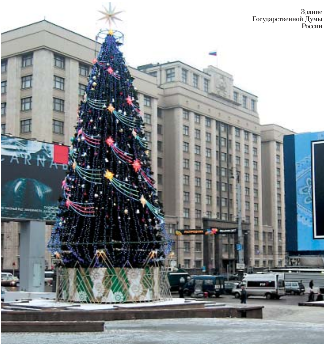
Здание Государственной Думы России

Другое дело, если предприятия под диктовку федерального центра