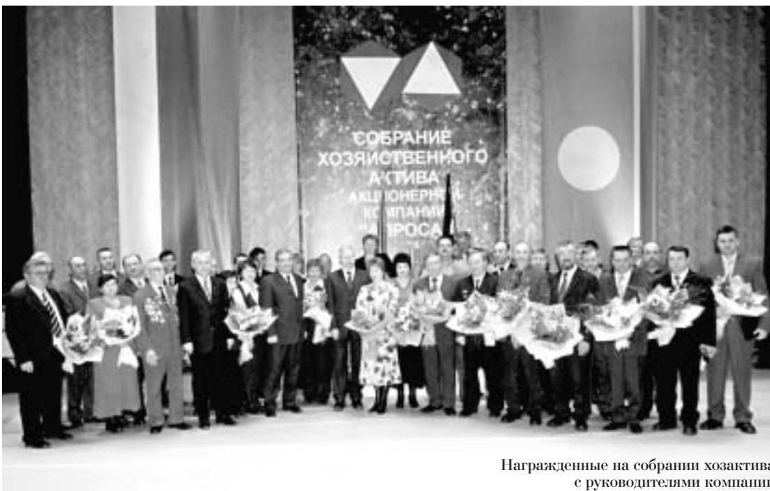
Награжденные на собрании хозяйственного актива с руководителями компании