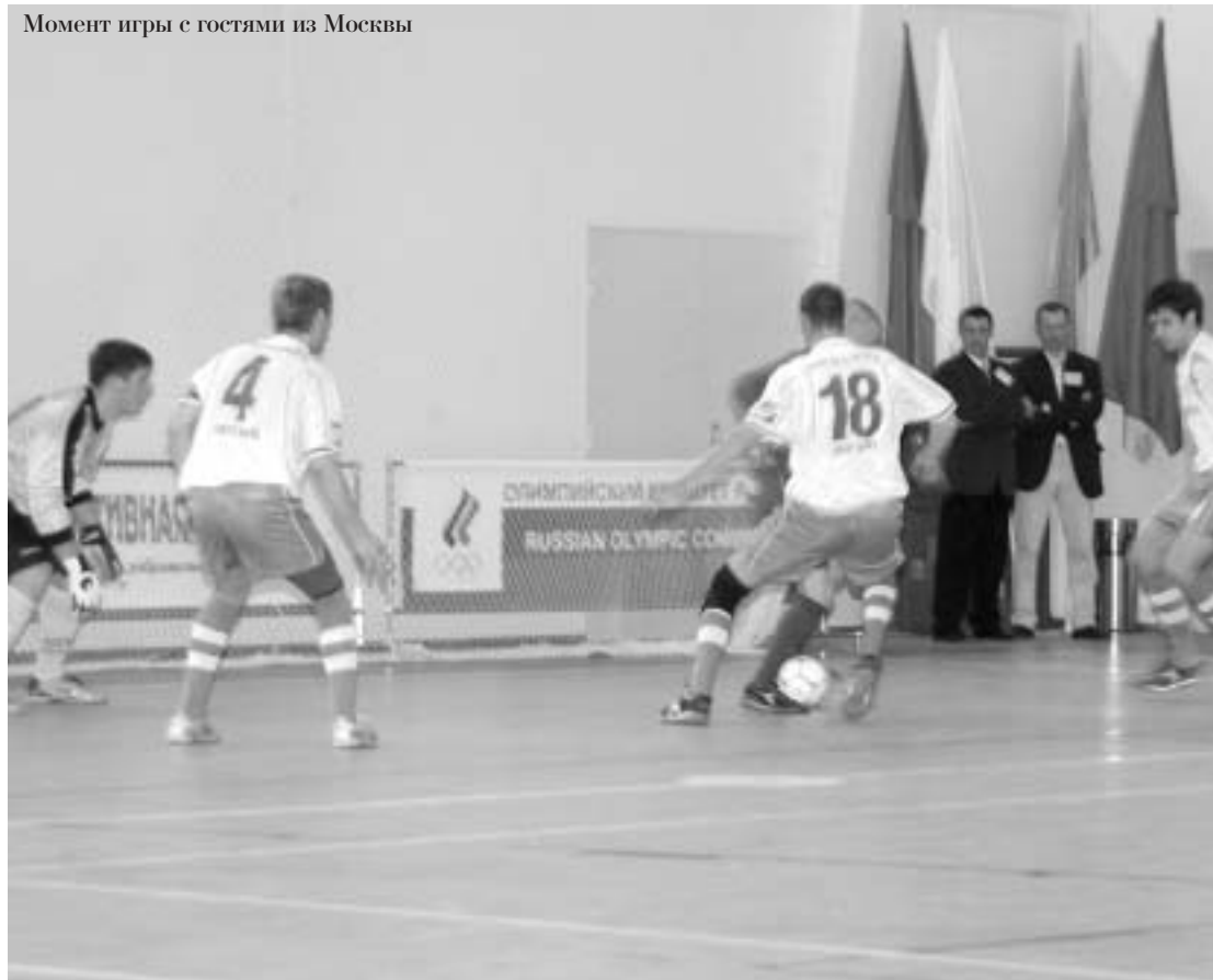
Момент игры с гостями из Москвы

Стоит признать, что для команды "Алмаз-АЛРОСА", участвовавшей в играх международного уровня, победа в республиканском чемпионате хотя и является достойным результатом, но это все-таки только старт в борьбе за титулы в российских, европейских и международных соревнованиях.