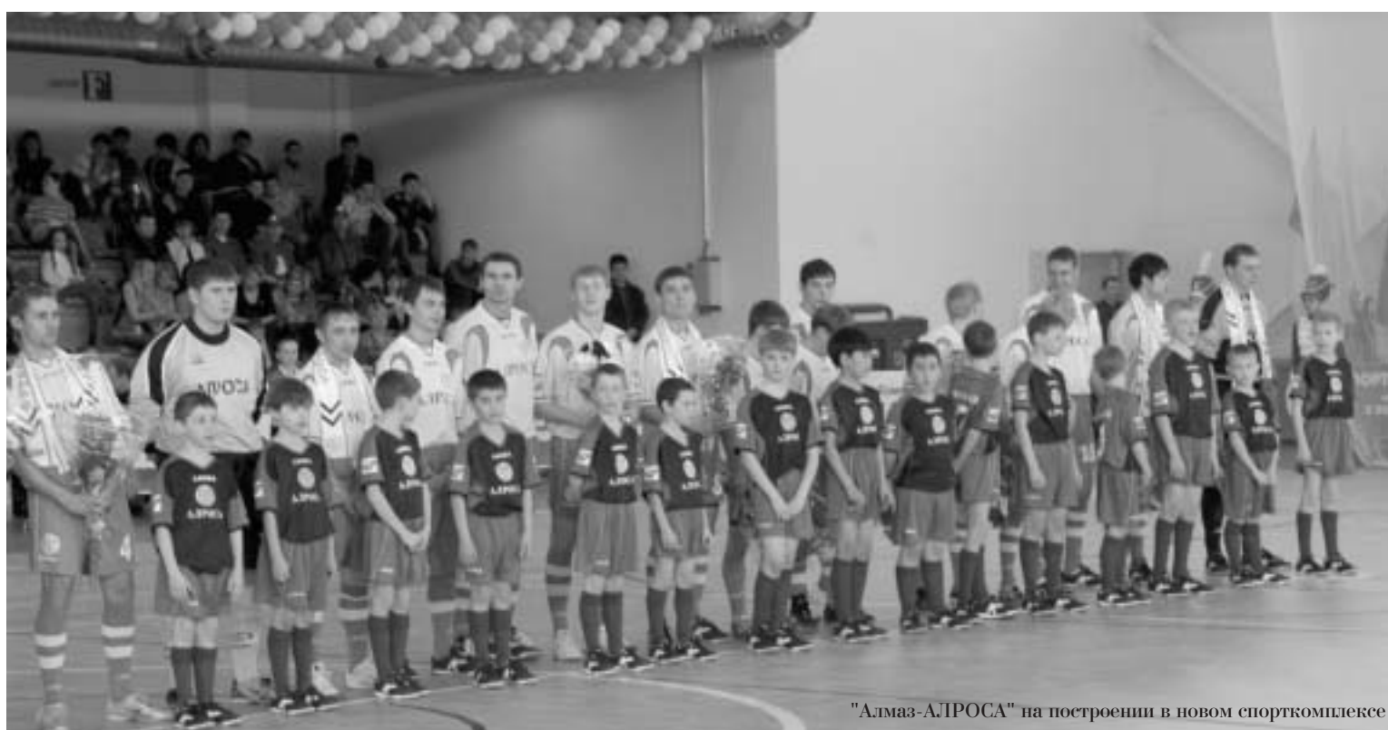
"Алмаз-АЛРОСА" на построении в новом спорткомплексе

будем объективны. Как упоминалось выше, "Алмаз-АЛРОСА" работает на два фронта. И пуская в мини-футболе мирницы только начинают, то в футзале они, как лидеры этого вида спорта, несут громадную нагрузку. "Алмаз-АЛРОСА" выступает на российском и на международном уровне. В России только что закончился Суперкубок. В настоящее время завершается XIII чемпионат России, заключительный этап которого, кстати, опять пройдет в Мирном. Грядет финал XIV Кубка России нынешнего сезона. Сразу по окончании российского чемпионата команду ждет Кубок Содружества. На международном уровне "Алмаз-АЛРОСА" будет выступать в мае на XV Кубке европейских чемпионов.