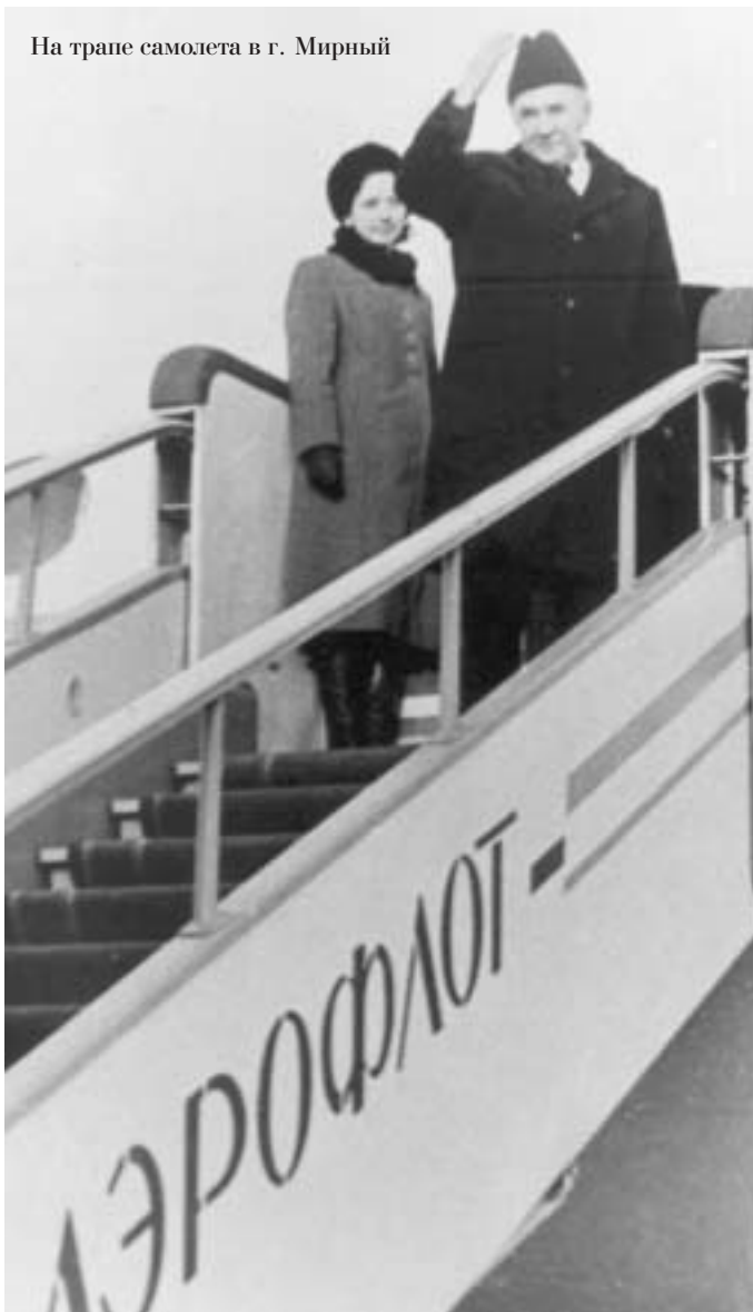
На трапе самолета в г. Мирный

"Ну, как работают новые белорусские автомашины?". Те отвечают, что машина-то хорошая, но вот резина всего 5 тысяч километров выдерживает, куда это годится?". Антонов обращается к тому заместителю министра, который выдает резину. Он отвечает "Мы тут ни при чем. Это виноват Бобруйский завод Минхимпрома, который должен