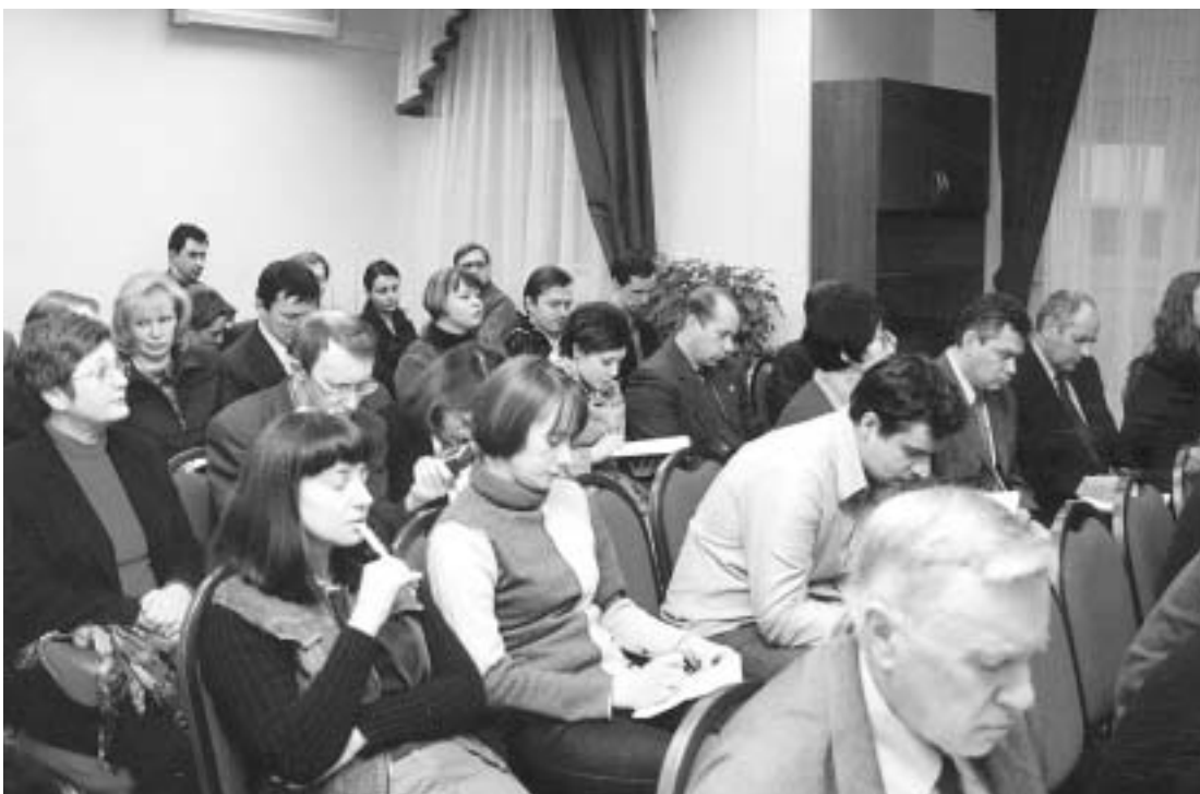
В зале пресс-конференции