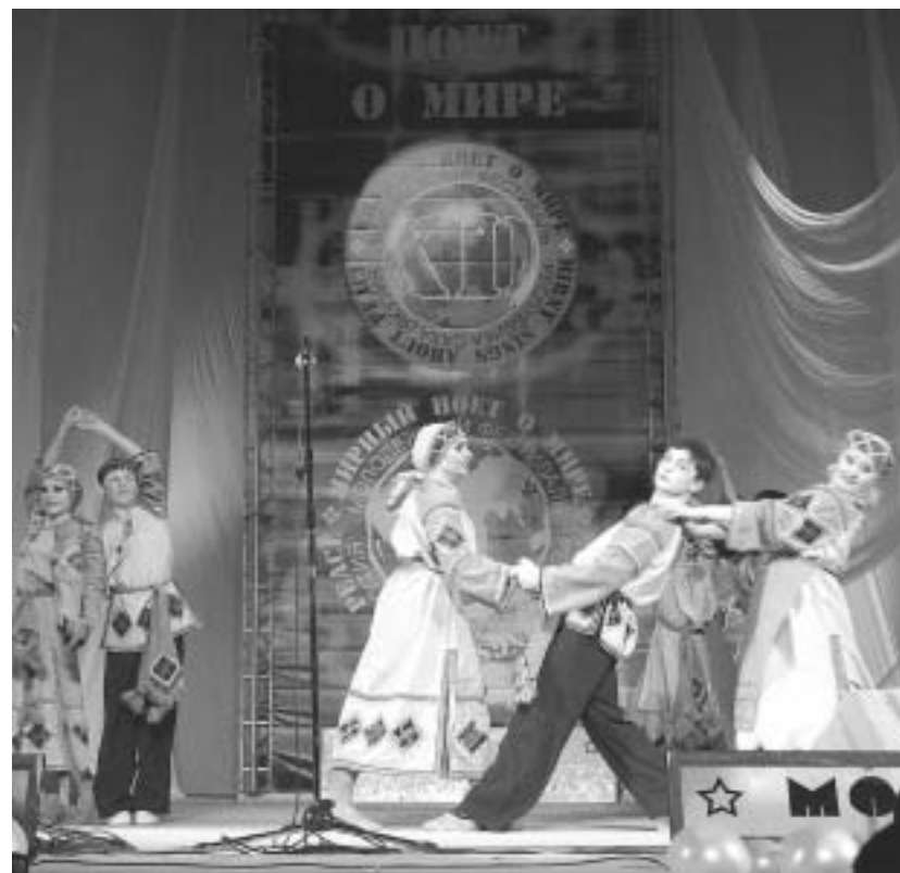
Выступает танцевальный коллектив "Дивертисмент"

Поддержка талантов — один из принципов социальной политики компании "АЛРОСА"