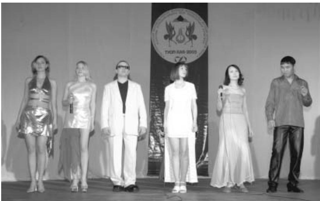
Участники фестиваля "Туой-Хая"

В течение трех фестивальных дней и ночей (конкурсные программы порою длятся до двух-трех ночи) гостей и участников необык-