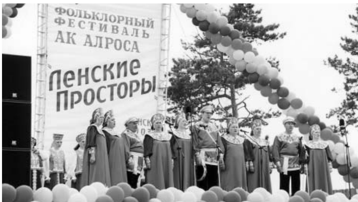
Участники фольклорного фестиваля — ансамбль "Раздолье" (автобаза Мирнинского ГОКа)

попробовать экзотические блюда национальной кухни.