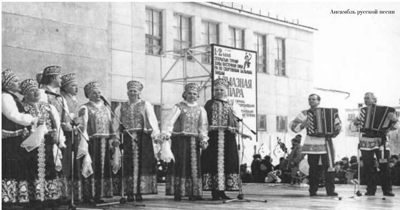
Ансамбль русской песни

идеями, новым поколением. Сегодня молодежный фестиваль "Мирный поэт о мире" среди всех наших праздников, пожалуй, самый яркий, желанный. В прошедшем фестивале, приняли участие 360 человек. 100 иногородних коллективов, которые приехали из Москвы, Минска, Якутска, Киева, Нерюнгри, Андрушкино, Ленска, Удачного, Арылаха, Сунтара. Всего прошло 12 выездных концертов, 9 концертов в ДК "Алмаз", 5 фотовыставок, 4 выставки плакатов, рисунков и газет. А еще просмотр видеороликов социальной рекламы, мастер-класс в клубе бардовской песни.