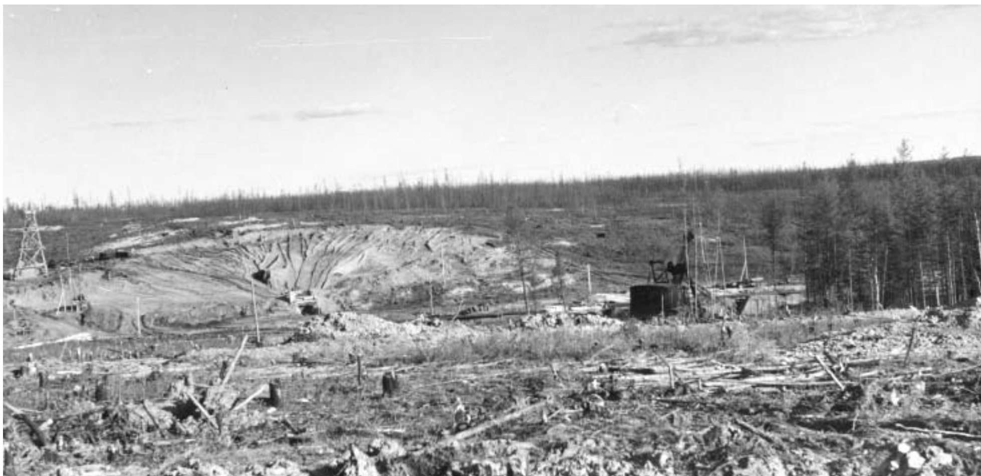
Трубка "Мир". 1957 год.