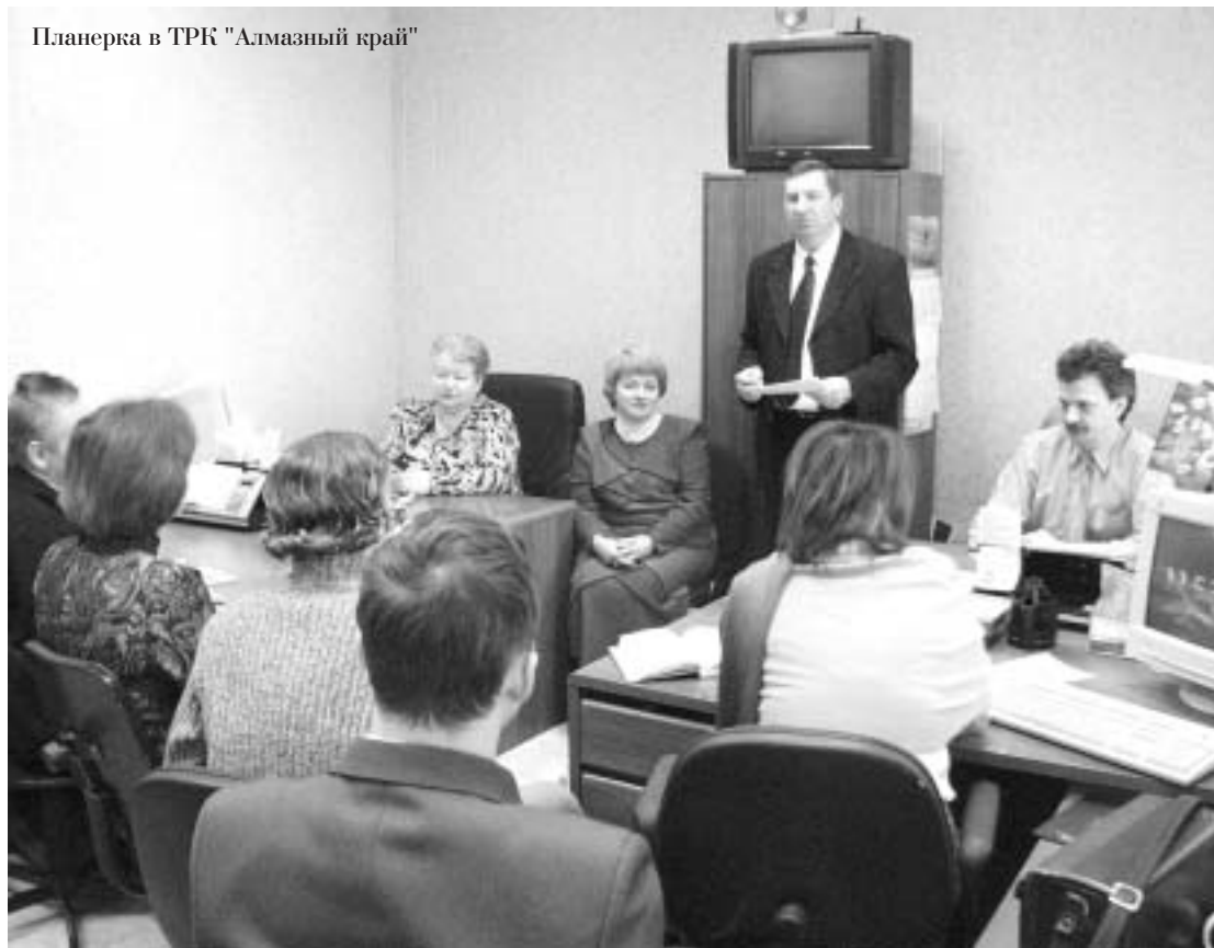
Планерка в ТРК "Алмазный край"

Наибольшей популярностью у телезрителей пользуются "Прямые эфиры", новостные блоки, тематические передачи "Твои люди, компания", "Люди алмазного края", "Прием по личным вопросам", передачи, направленные на профилактику наркомании и борьбу со СПИДом. Мы освещаем деятельность и тех структур, которые не входят в состав компании: здравоохранения, образования, правоохранительных органов.