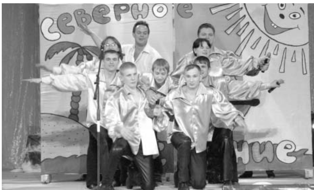
Победитель четвертьфинала турнира "Алмазной лиги" — команда "Северное сияние" (прииск "Ирелях")

надеются организаторы, станет переходящим. Впервые начали работу творческие мастерские, мастер-класс во время предварительного просмотра вела редакторская группа игроков КВНа Высшей и "Премьер" лиг Международного союза КВН. Впервые в 2003 году команды Высшей лиги приняли участие в заключительном гала-концерте.