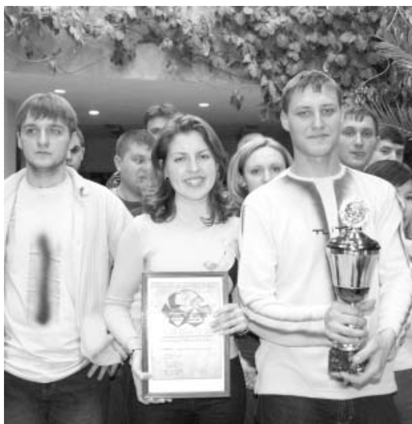
Обладатели "Алмазного кубка" — команда "62-я параллель"

Многоцветье красок, талантов, событий — ярмарки, концерты, игры. Два дня перед ленчанами выступали лучшие народные коллективы городов Мирного, Удачного, Ленска, поселков Айхала, Анабара, Алмазного, национальных общин Мирнинского отделения Ассамблеи народов Якутии. Были организованы ярмарки ремесел, участниками которых стали мастера-умельцы подразделений "АЛРОСА" — Ленских авторемонтных мастерских, сувенирного цеха УГОКа и другие. "Палитра северных широт" была представлена работами художников, резчиков, мастериц из детских и подростковых клубов. На набережной Лены проходила выставка-продажа кулинарных и кондитерских изделий, где можно было