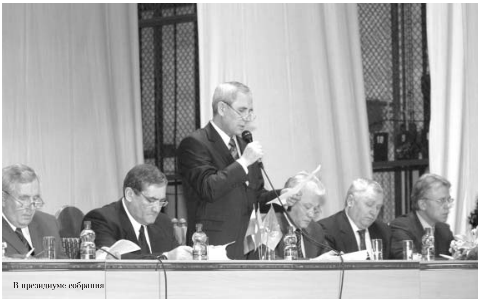
В президиуме собрания