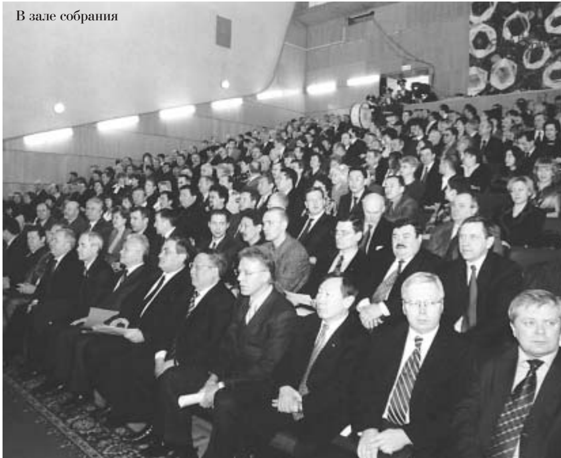
В зале собрания

Общая ситуация на мировом рынке, планы Правительства РФ по дальнейшей либерализации в сфере обращения алмазов и бриллиантов позволяют с оптимизмом смотреть в будущее