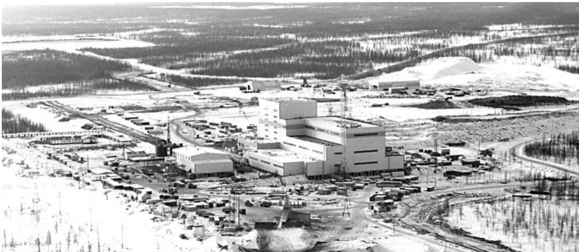
Накын, алмазобогатительная фабрика №16