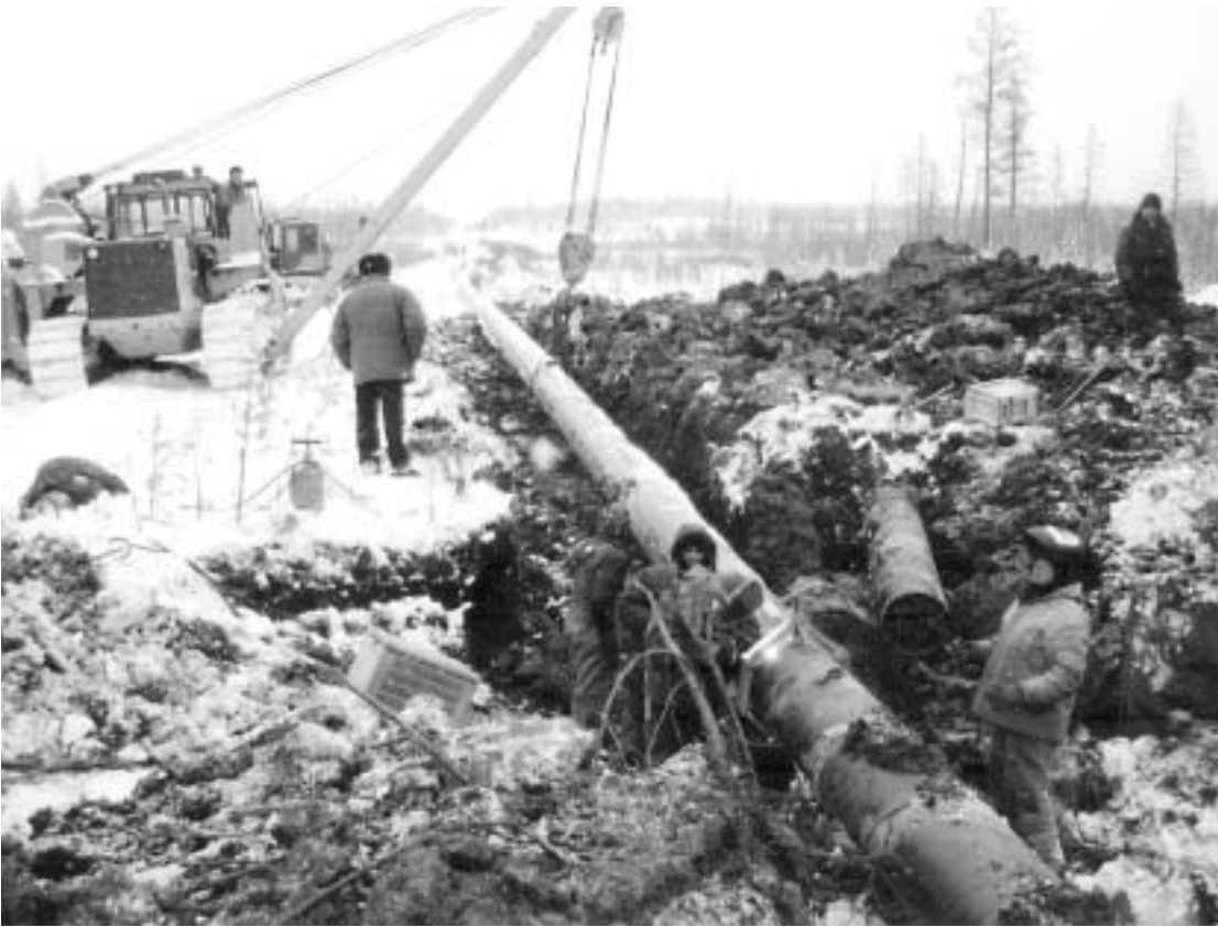
Ремонтная бригада выполняет работы на участке газопровода

В последнее время в СМИ Якутии все чаще поднимается вопрос о неудовлетворительном состоянии магистральных газопроводов республики, о недостатке финансирования газовой отрасли, об износе основных фондов.