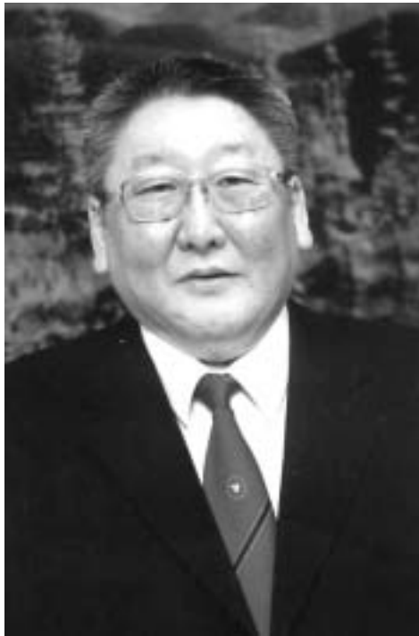
Советом при Правительстве Республики Саха (Якутия).

Первым заместителем председателя Наблюдательного совета, выполняющим свои функции на постоянной основе, назначен Егор Афанасьевич Борисов. Он — доктор экономических наук, Председатель Правительства Республики Саха (Якутия). Родился в селе Чурапча Якутской АССР 15 августа 1954 г. Работал слесарем-ремонтником Чурапчинского РО "Сельхозтехника", учился в Новосибирском сельскохозяйственном институте. С 1979 по 1991 г. работал в Чурапчинском районе, в том числе — заведующим мастерскими райсельхозтехники, первым заместителем начальника Чурапчинского районного управления сельского хозяйства, вторым секретарем Чурапчинского райкома КПСС, председателем Чурапчинского районного Совета народных депутатов.