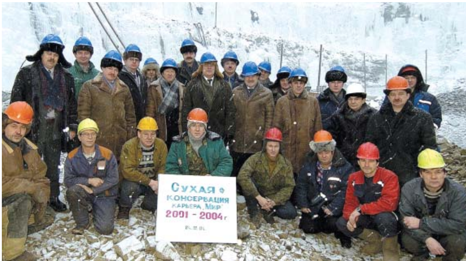
Участники знаменательного события