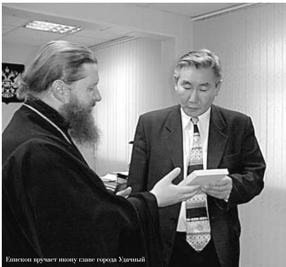
Епископ вручает икону главе города Удачный