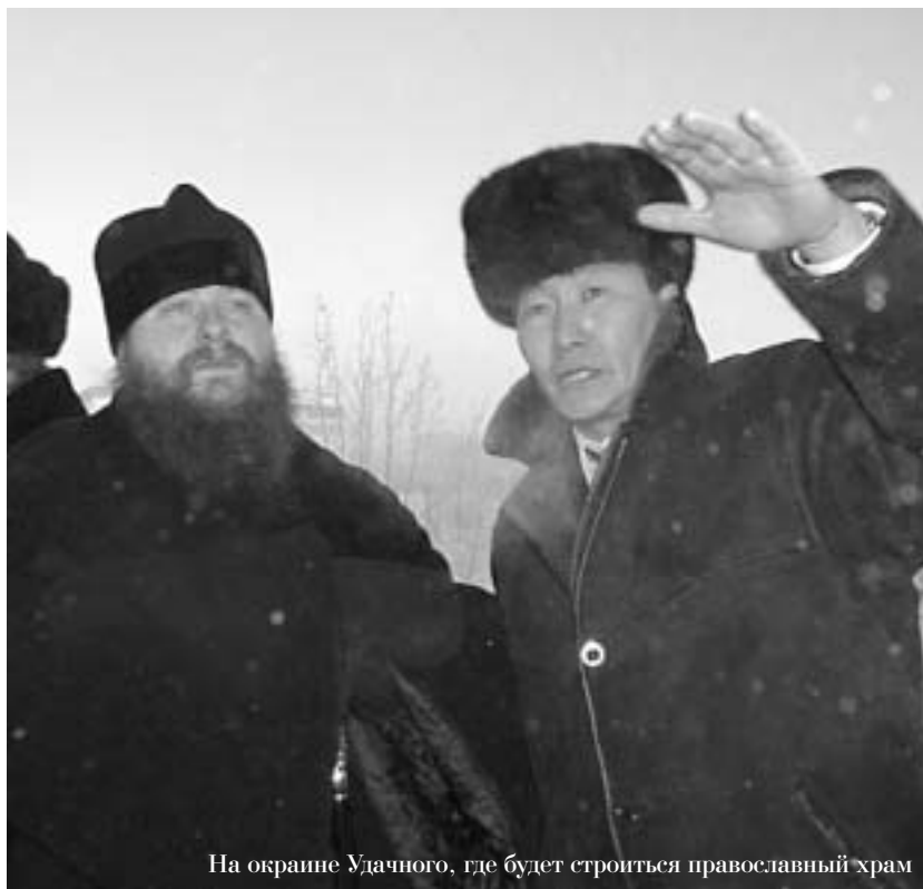
На окраине Удачного, где будет строиться православный храм

Владыка Зосима получил назначение на пост епископа в конце лета прошлого года: будучи в сане игумена — протоиерея Свято-Данилова монастыря в Подмоскowie, он был возведен в сан архимандрита, а на Воздвиженье рукоположен в сан епископа.