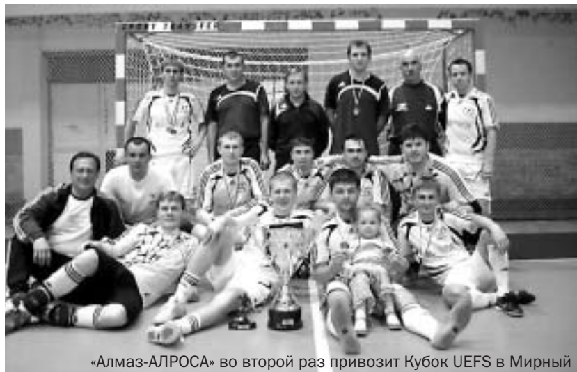
«Алмаз-АЛРОСА» во второй раз привозит Кубок UEFA в Мирный

«Они были на голову сильнее соперников!»