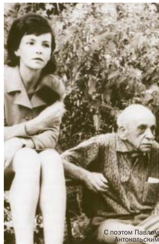
С поэтом Павлом Антокольским

Словно по асфальту, по брусчатке, Словно по летящей глади рек... И стоит на смотровой площадке Маленький – всесильный Человек! (Мирный, 1992 г.)