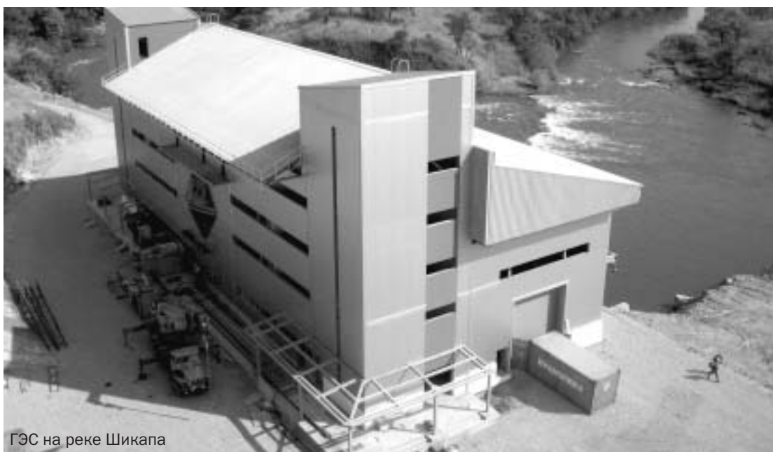
ГЭС на реке Шикапа

– Мы в Африке намного больше диверсифицированы, чем в России. Это алмазодобыча, два проекта – ГРО "Катока" и "Луо" – ГРО "Камачия-Камачику", новый успешный проект "Каколу" в сфере геологоразведки и добычи. Кроме того, мы недавно ввели в строй гидроэлектростанцию на реке Шикапа, а также ряд объектов инфраструктуры.