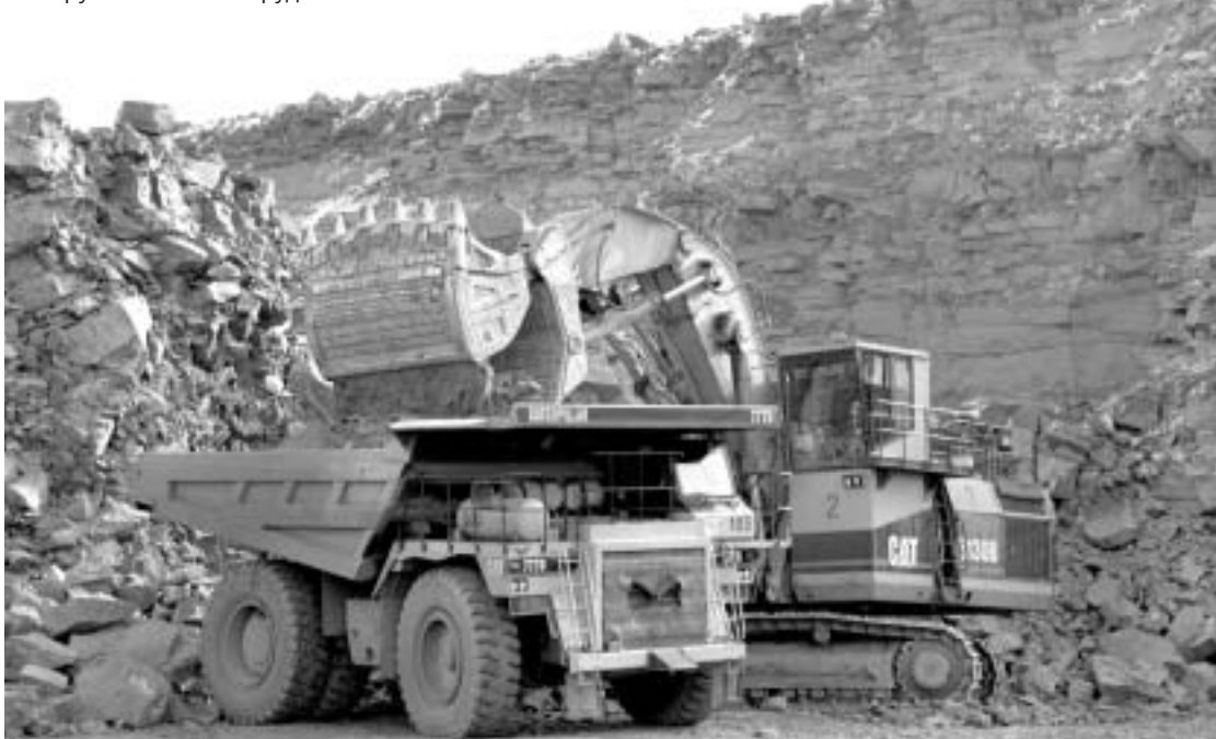
Погрузка алмазной руды

– В США наблюдается падение спроса на ювелирные изделия с бриллиантами. Как это отразится на мировом рынке драгкамней?