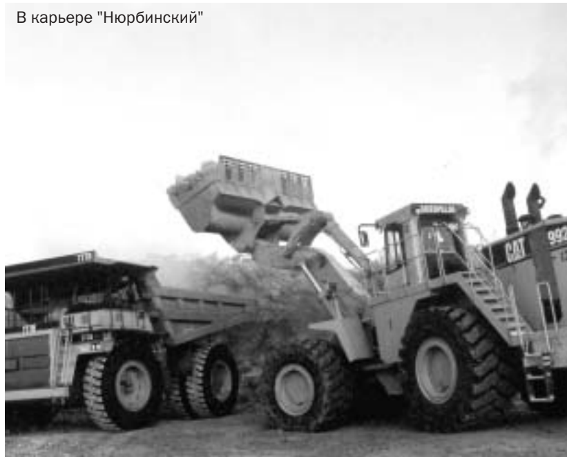
В карьере "Нюрбинский"

В аналитических проработках использовался максимально доступный объем информации. В расчетах учитывали экономико-географическое положение месторождений, их рельеф, степень освоенности района, действующие транспортные схемы. Важнейшим фактором анализа были реально существующие на данный момент цены на алмазное сырье, энергоресурсы, система и ставки налогообложения, таможенные тарифы. Конечно, анализировали и нынешние показатели разработки трубки "Нюрбинская" (добыча здесь с 2000 года