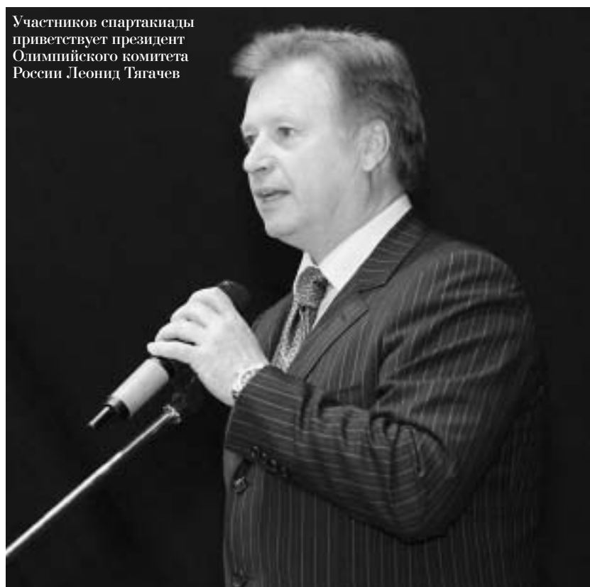
Участников спартакиады приветствует президент Олимпийского комитета России Леонид Тягачев