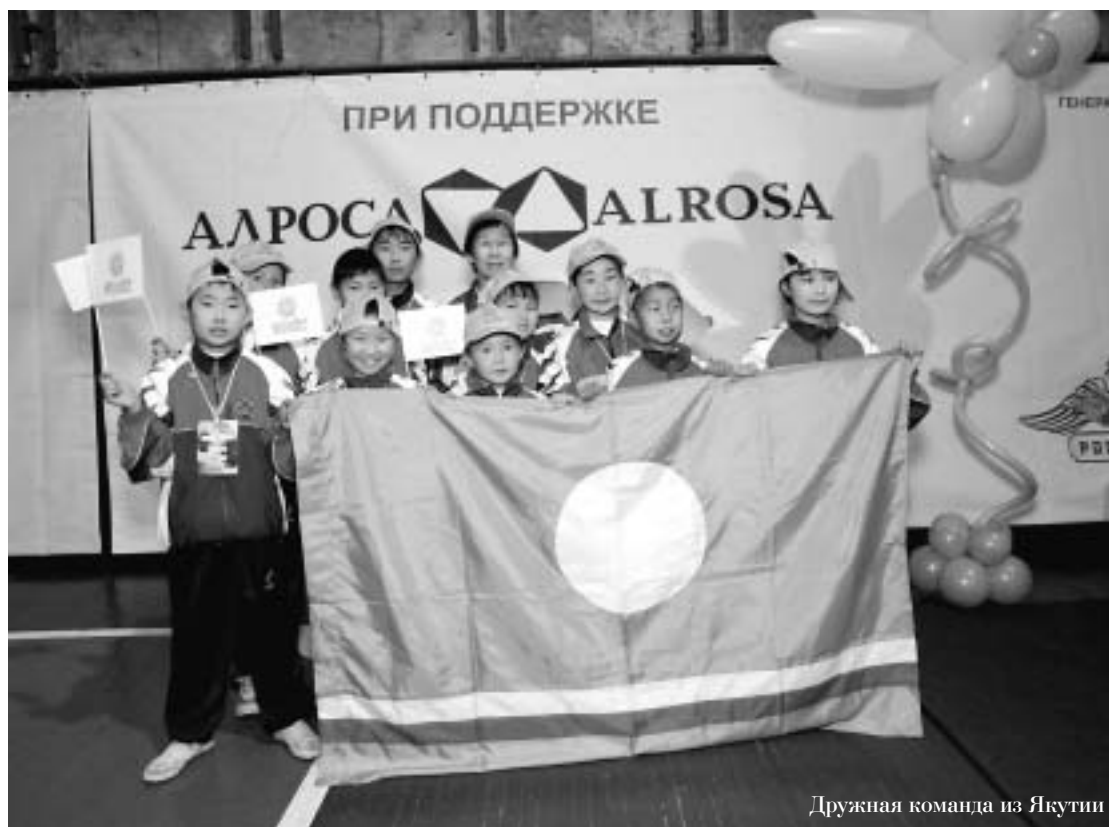
Дружная команда из Якутии