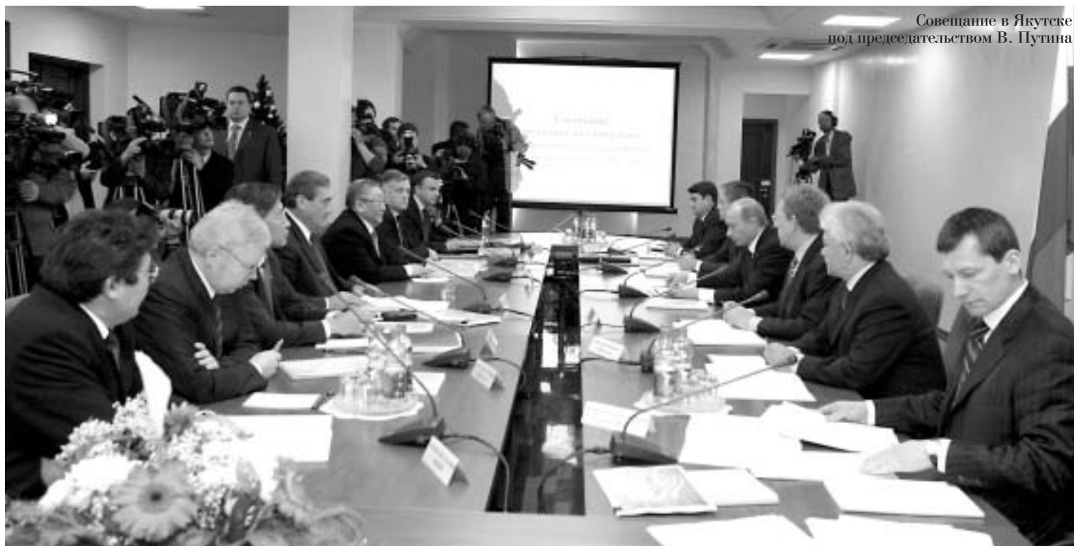
Совещание в Якутске под председательством В. Путина

Глава государства провел в Якутске совещание по вопросам экономического развития Республики Саха (Якутия). В совещании, в частности, приняли участие Президент Республики Саха (Якутия) Вячеслав Штыров, министр финансов РФ Алексей Кудрин, министр транспорта РФ Игорь Левитин, помощник Президента РФ Александр Абрамов, президент компании "АЛРОСА" Александр Ничипорук, президент ОАО "РЖД" Владимир Якунин, член правления РАО "ЕЭС России" Вячеслав Синюгин.