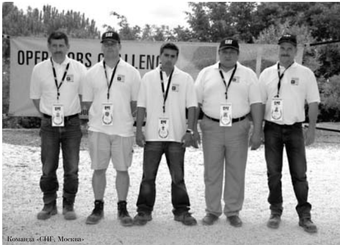
Команда «СНГ, Москва»

для выполнения на 12-ти видах техники. Соревнования проходили с 3 по 6 октября, по 4 задания в день — два до обеда и два после. Микроавтобусы развозили команды по участкам, пешком передвигаться по территории и участникам и гостям было запрещено.